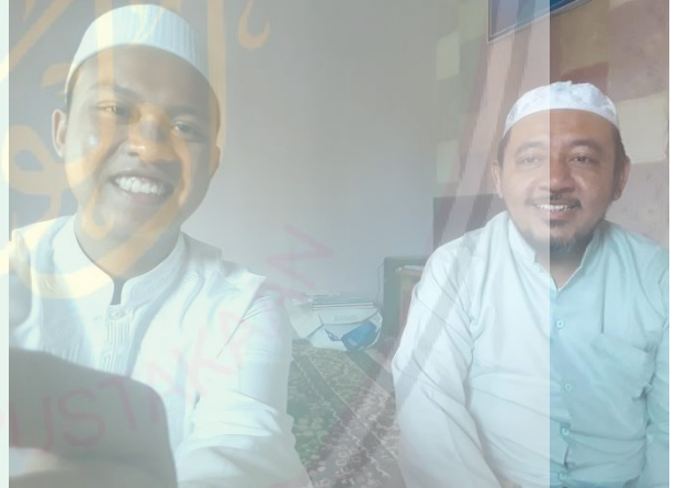
الصورة: مقابلة مع معلم مهارة الكلام في جامعة دار اللغة والدعوة الاسلامية الحكومية