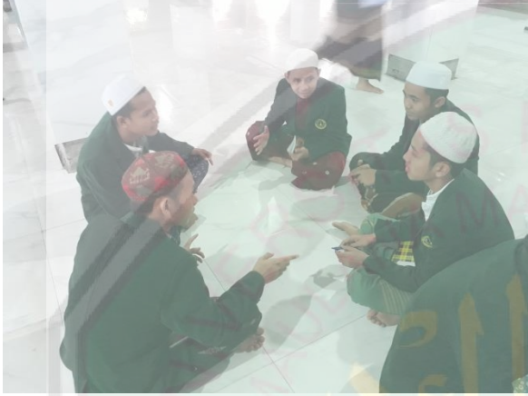
الصورة: عملية المحاورة في الفصل (يجعل الطلاب مجموعة مع أصدقائهم في المجموعة)