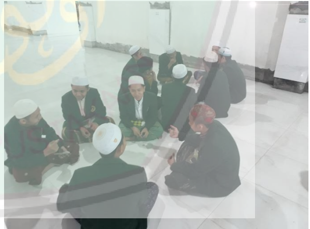
الصورة: عملية المحاورة في الفصل (يجعل الطلاب مجموعة مع أصدقائهم في المجموعة)