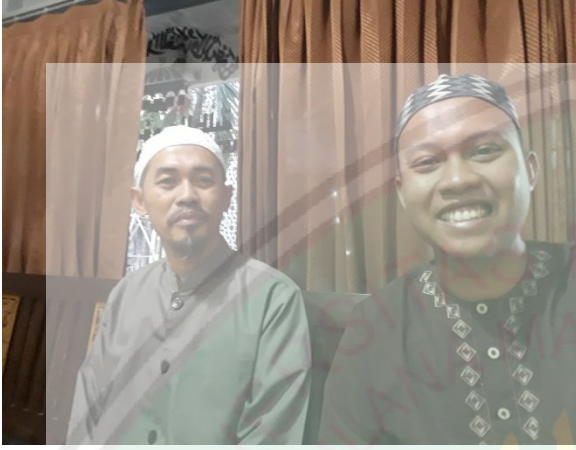
الصورة: مقابلة مع رئيس اللغة العربية في معهد دار اللغة والدعوة