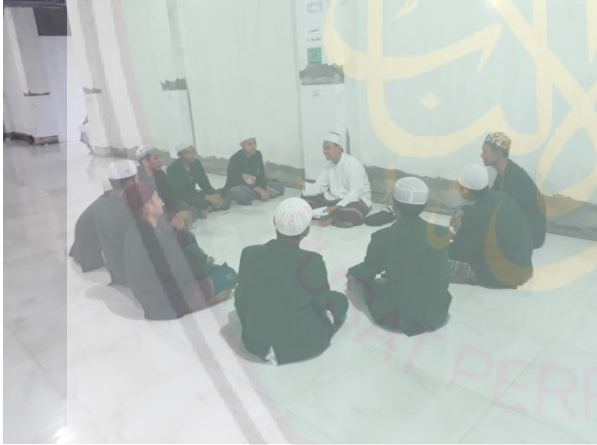
الصورة: مقابلة مع طلاب المستوى الأول في جامعة دار اللغة والدعوة الاسلامية الحكومية