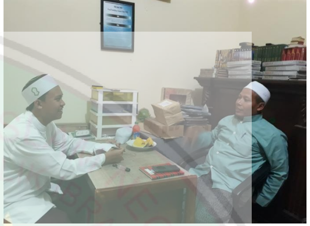
الصورة: مقابلة مع رئيس قسم تعليم اللغة العربية في جامعة دار اللغة والدعوة الاسلامية الحكومية