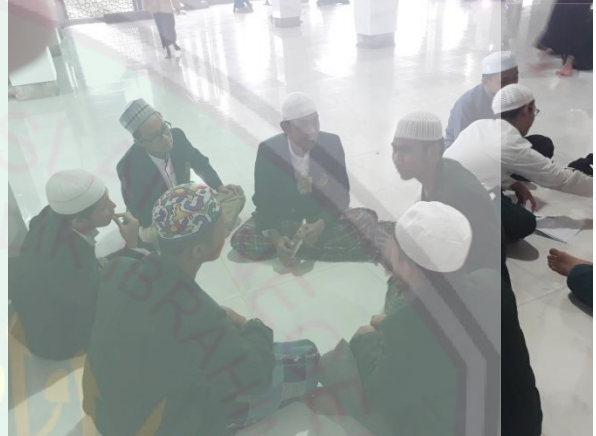
الصورة: عملية المحاورة في الفصل (يجعل الطلاب مجموعة مع أصدقائهم في المجموعة)