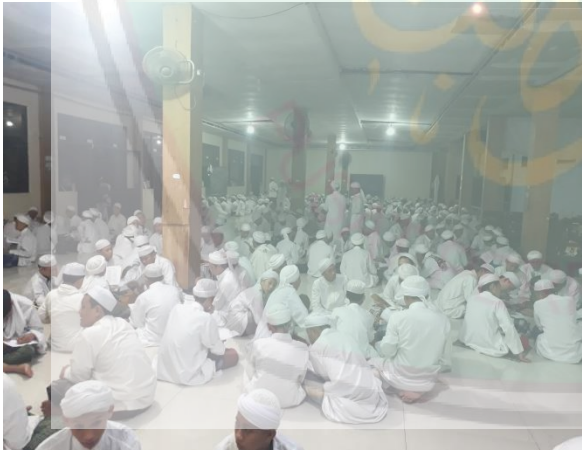
الصورة: عملية المحاورة في برنامج المسكن لجميع التلاميذ بمعهد دار اللغة والدعوة