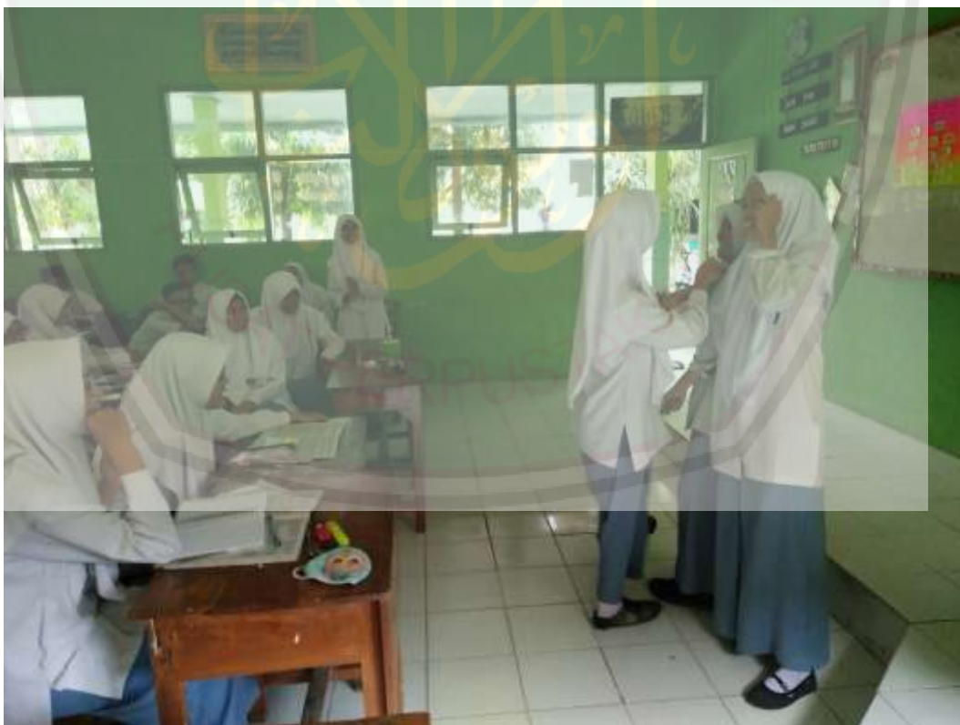
Gambar 4.1 Gambar Kegiatan KBM dikelas

Hasil observasi yang dilakukan peneliti juga didukung dengan dokumentasi mengenai pelaksanaan pendidikan karakter dalam membentuk sikap sosial peserta di kelas VIII D. 77