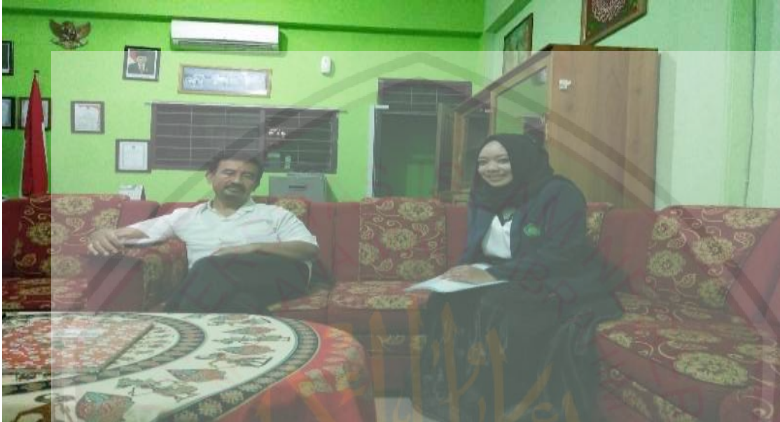
wawancara dengan Bapak waka kesiswaan