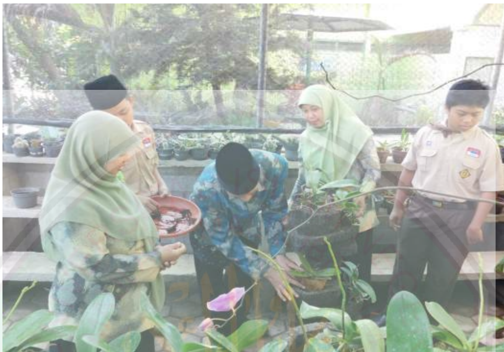
Gambar 4.2 Gambar Kegiatan ADIWIATA

Kegiatan yang dilakukan setiap hari ini akan berdampak positif terhadap peserta didik yang nantinya membentuk sikap-sikap sosial peserta didik itu sendiri. Dan selain pelajaran umum disini juga diajarkan bagaimana menjaga dan merawat alam. Selain itu sikap lain yang dibudayakan di sekolah ini yaitu seperti bentuk 6S (senyum, salam, sapa, salaman, sapa, sopan, santun) tadi, selain itu dengan membiasakan 6S dan kegiatan sebelum masuk kelas maupun sebelum pulang sekolah karakter peserta didik sudah terbentuk meskipun belum seutuh persen. Hal ini juga diungkapkan oleh Bapak Agus yang mengatakan 84 :