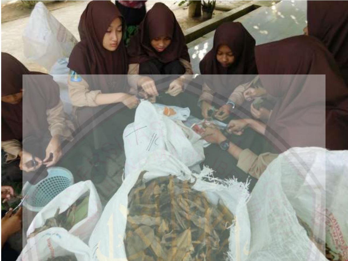
Kegiatan Kerajinan limbah daari sampah