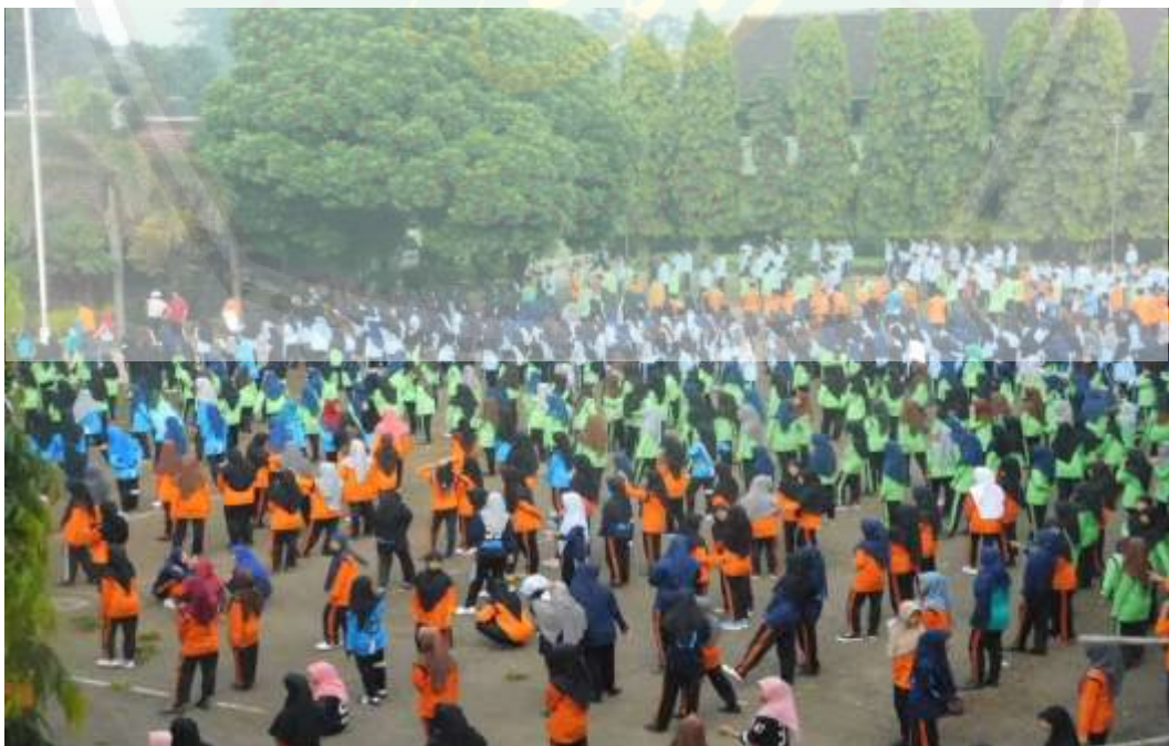
Kegiatan senam bersama