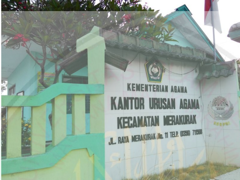
Kondisi KUA Kecamatan Merakurak dari depan