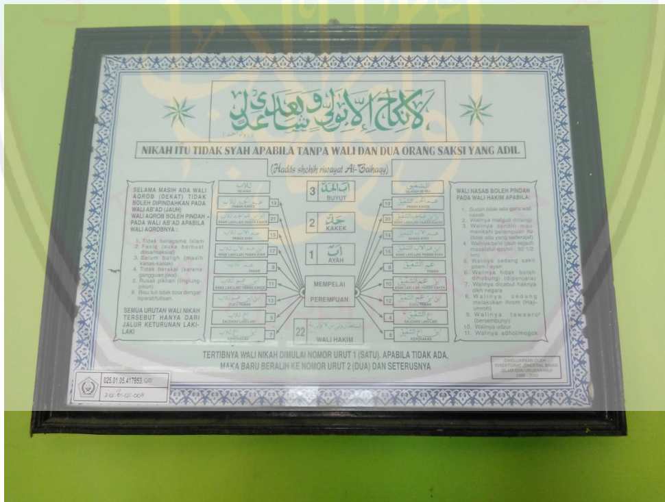
Grafik urutan wali dalam pernikahan