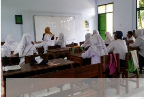
الصورة حينما شرحت الباحثة المادة من النص