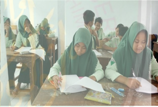
الإختبار بعدي في الفصل الثامن "ب"