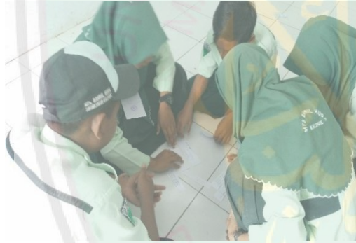
الصورة في اللقاء الثالث

حينما تحليلون التلاميذ الصورة المفردات بالكلمة المفتحية