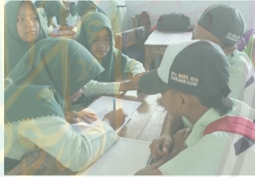
الصورة في اللقاء الرابع

حينما ينظمون التلاميذ قطعة من القرطاس من نص القراءة