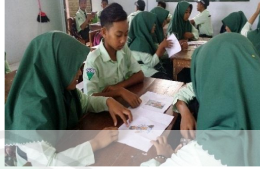
الصورة في اللقاء الثاني

حينما تحليلون التلاميذ الصورة المفردات بالكلمة المفتحية