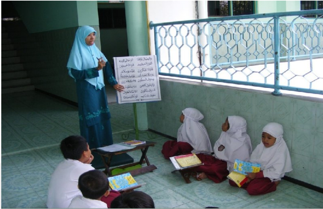
Gambar 2 : Proses Pembelajaran Metode Ummi