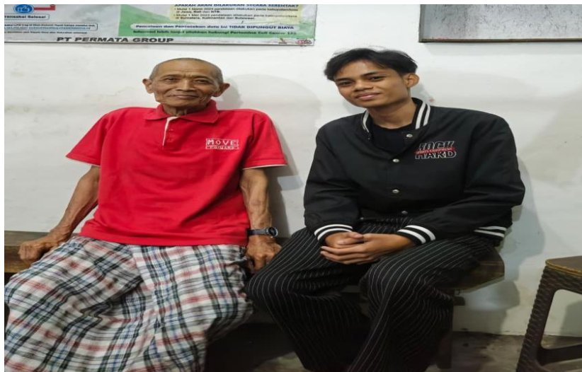
Wawancara dengan tokoh Masyarakat