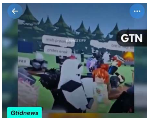
Gambar 4. 2

berpelukan, sehingga menimbulkan kesan interaksi yang bersifat intim dan mengarah pada unsur seksual tersirat. Dalam konteks permainan yang banyak diakses oleh anak-anak, adegan ini dapat dinilai tidak pantas karena mengandung nuansa sugestif serta berpotensi melanggar norma, terlebih dilakukan di ruang privat.