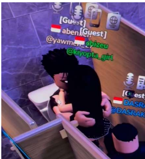
Gambar 4. 1

Perkembangan teknologi informasi dan komunikasi yang pesat telah membawa perubahan signifikan dalam pola interaksi sosial anak, termasuk dalam aktivitas bermain. Salah satu platform permainan daring yang populer di kalangan anak-anak adalah Roblox. Platform ini memungkinkan pengguna untuk berinteraksi, berkomunikasi, serta bermain bersama pemain lain dari berbagai wilayah melalui sistem permainan berbasis dunia virtual. Di satu sisi, platform ini memberikan ruang kreativitas dan hiburan bagi anak, namun di sisi lain juga berpotensi menimbulkan risiko, termasuk potensi terjadinya kekerasan seksual berbasis daring terhadap anak. Berikut adalah contoh bentuk dari kekerasan seksual dalam game Roblox.