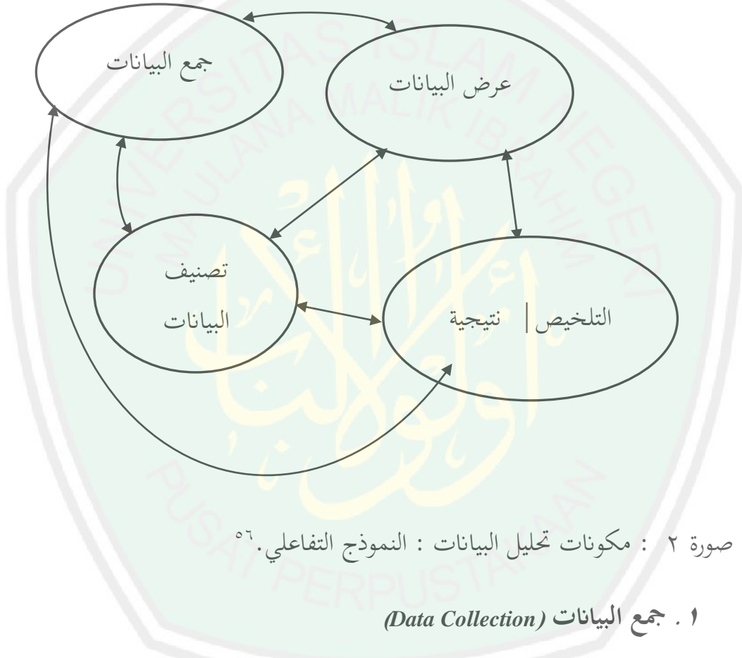
جدول ٢ خطوات تحليل البيانات.

جمع البيانات تعتبر البيانات التي تظهر بالكلمات وليس من الأرقام. وقد تم جمع البيانات في مجموعة متنوعة من الطرق ( الملاحظة والمقابلة ودراسة الوثائق) وعادة من عملية غير الجاهزة أن تستخدم من خلال كتابة أو تسجيل وتحقيق. البحث الكيفي سيكتيب جملة البيانات الكثيرة ومعقدة، والبيانات تميل إلى تبذوتافهة. الباحث جمع