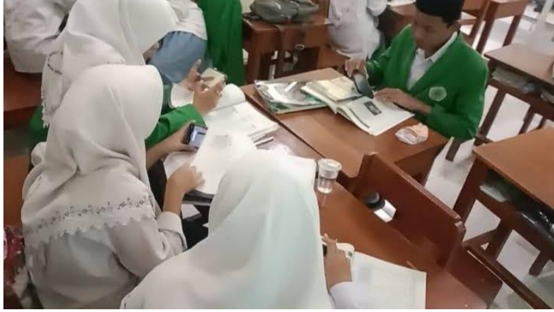
ممارسة عرض محتوى النص على أعضاء المجموعة