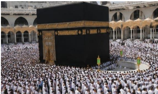
3. الطواف (Tawaf)