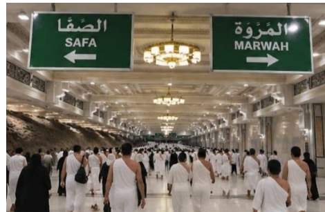
4. السعي (Sa'i)