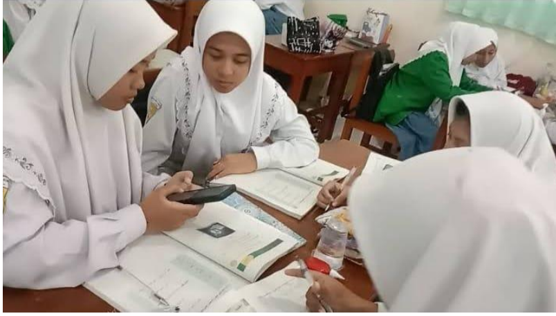
توزيع النص على الطلاب وفهم محتواه