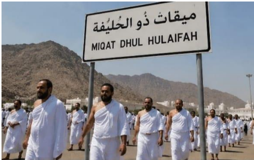
1. الإحرام (Ihram)