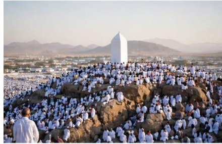
الوقوف بعرفة (Wukuf di Arafah)