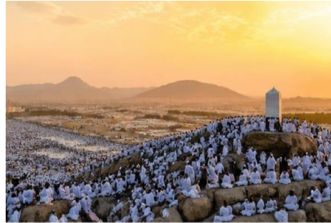
2. الوقوف بعرفة (Wukuf di Arafah)