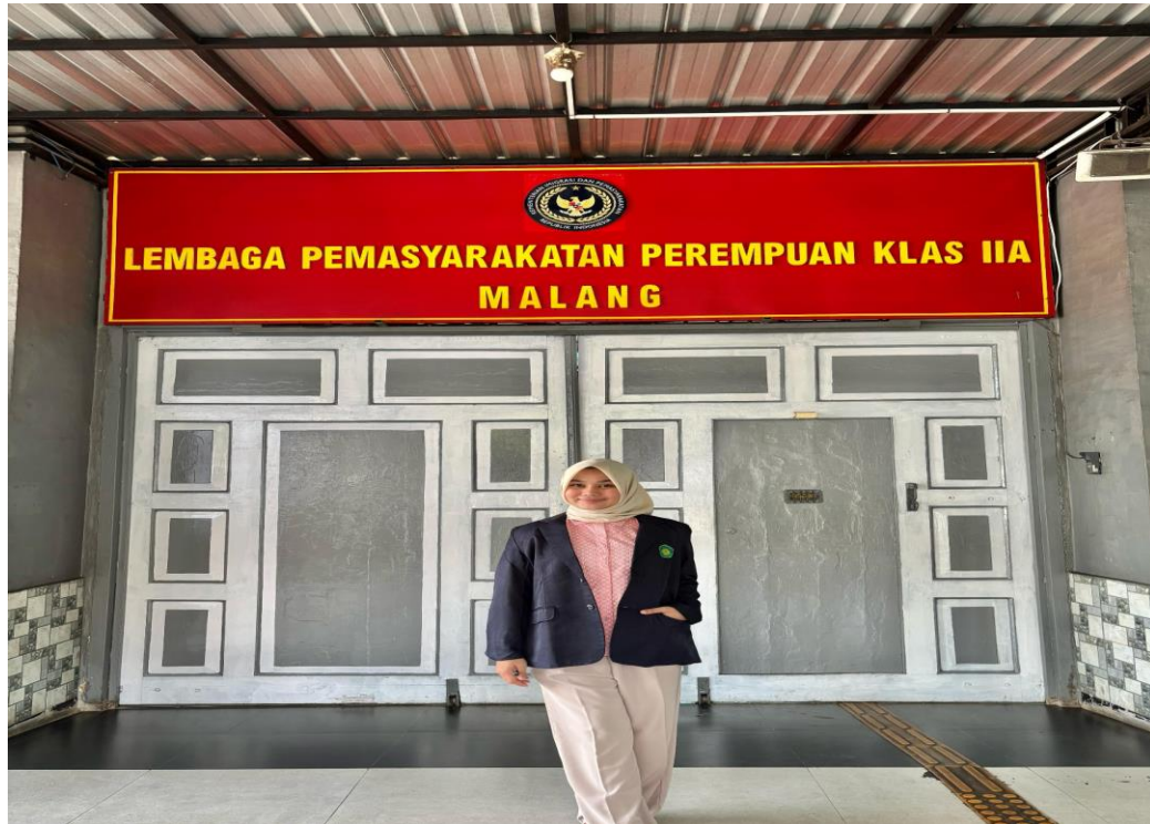
Gambar 5.5 Observasi Peneliti Ke Lembaga Pemasyarakatan Perempuan Kelas IIA Kota Malang Pada Tanggal 19 November 2024