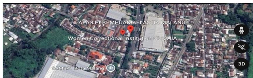
Gambar 4.1 Lokasi Penelitian