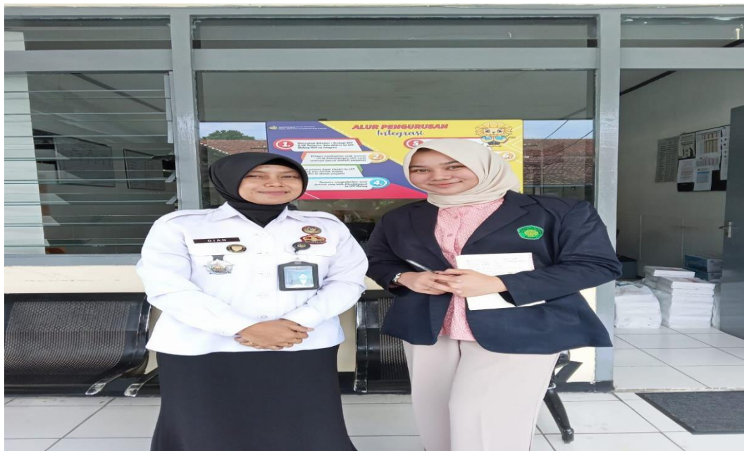
Gambar 5.4 Wawancara Peneliti Dengan Kasubsi Kemasyarakatan Dan Keperawatan Lapas Perempuan Kelas IIA Kota Malang Pada tanggal 19