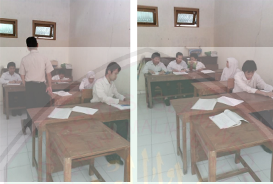
الصورة من عملية تعليم اللغة العربية في مدرسة يكتونس المتوسطة