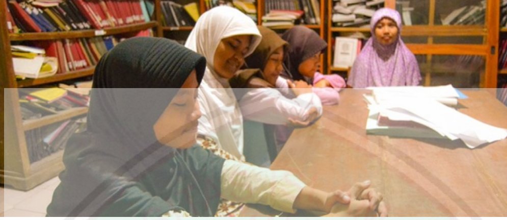
عملية التعلم مع الطلاب الجامعة