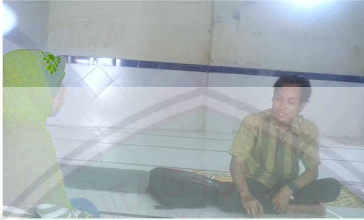
عملية المقابلة مع المعلم