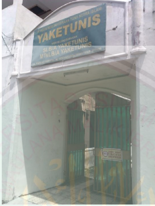
باب المدرسة يكتونس المتوسطة