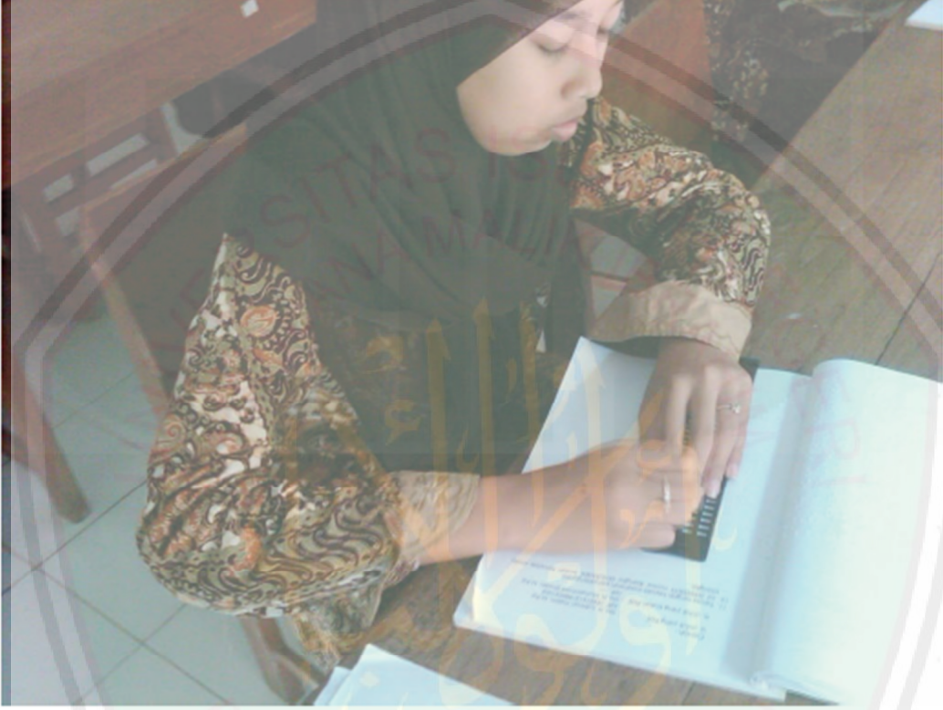
الصورة من الطالبة المكفوفة التي تكتب البرايل