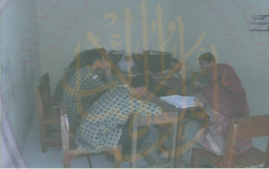
عملية تعلم تعليم الكتابة والقراءة بعد صلاة المغرب