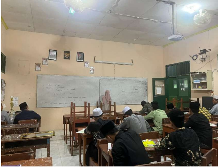
عملية الإعداد والتطبيق في المستوى الأولى