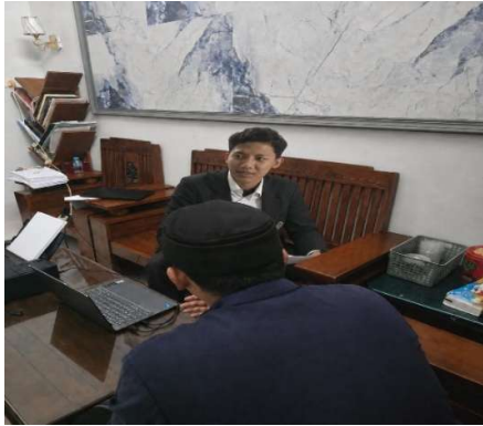
مقابلة مع منسق معهد الحكمة