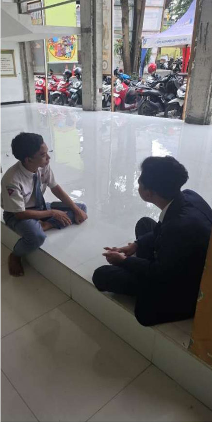
مقابلة مع طالب معهد الحكمة