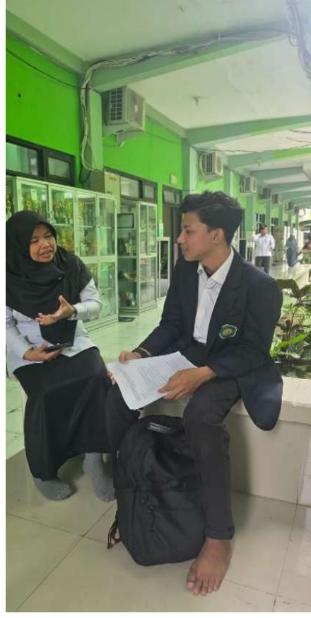
مقابلة مع مشرفة معهد الحكمة