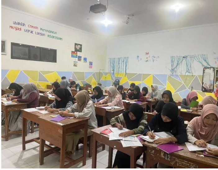
عملية التقويم في المستوى الأولى