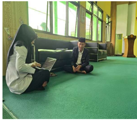
مقابلة مع معلّمة معهد الحكمة