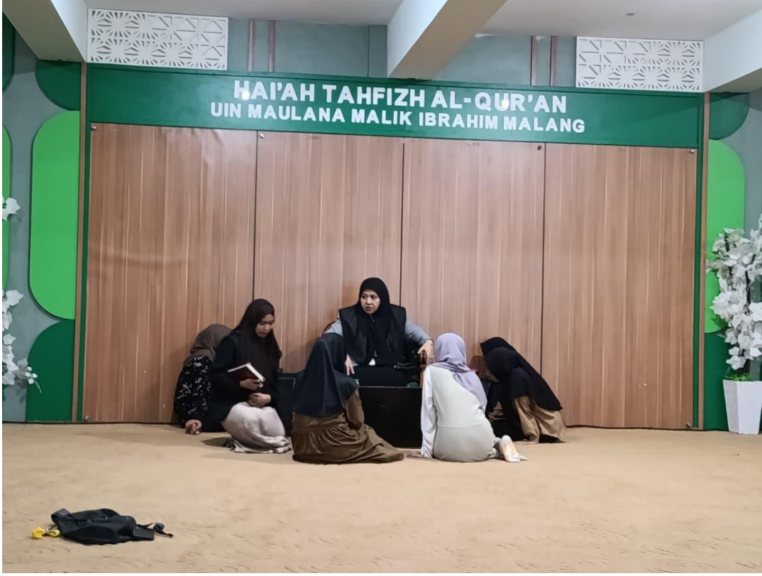
صورة نشاط الإيداع