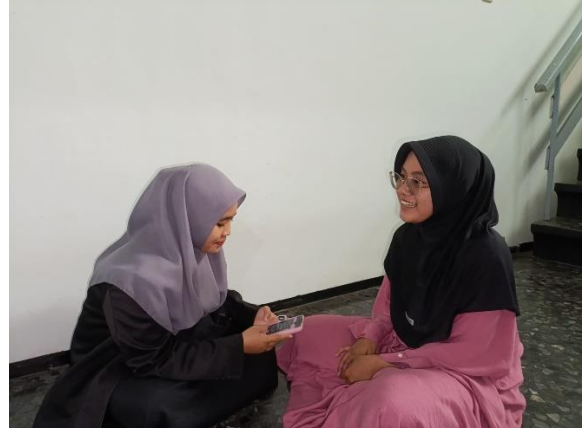
مقابلة مع فارا