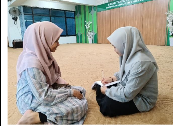
مقابلة مع فردا