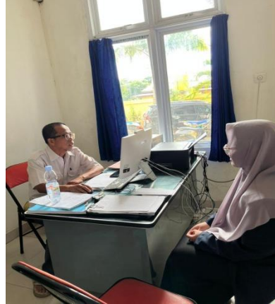
Gambar 8: Wawancara dengan ketua Lembaga Masyarakat Adat Marind dan salah satu pelaku Tradisi Masuk Minta