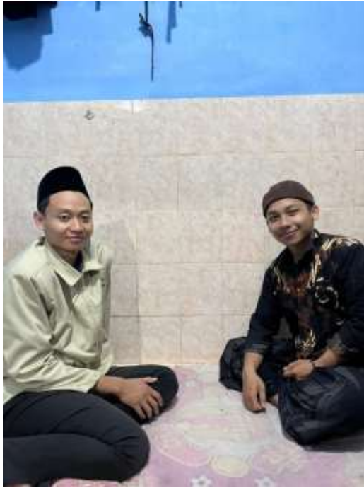
Gambar 1.1 Fotobersama Informan