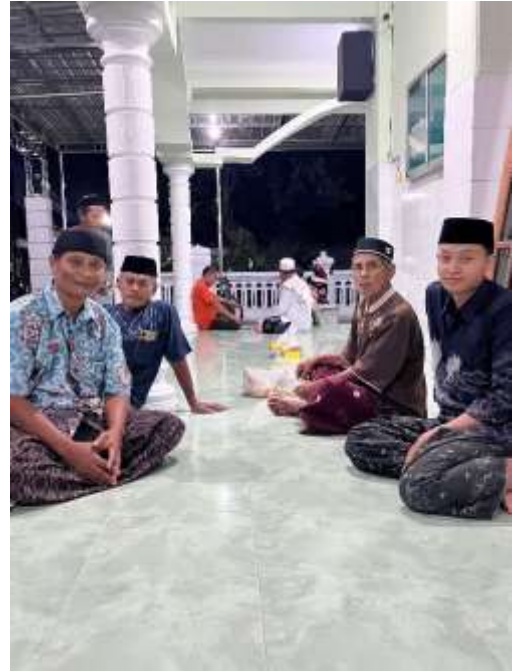
Gambar 1.2 Fotobersama Informan