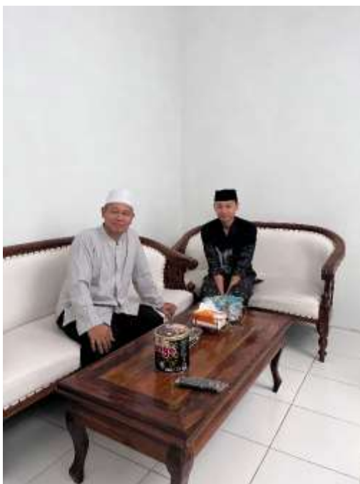
Gambar 1.3 Fotobersama Informan