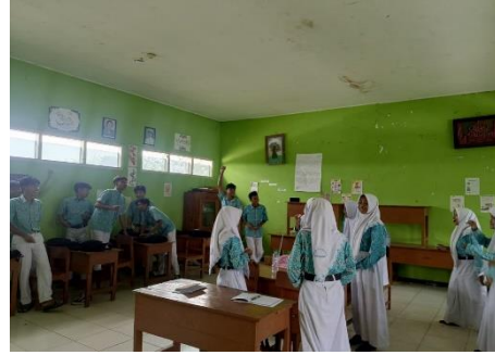
أنشطة التعليم باستخدام نموذج المراجعة