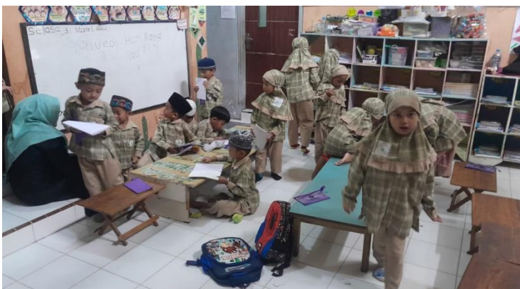
Gambar 3. Ruang Kelas