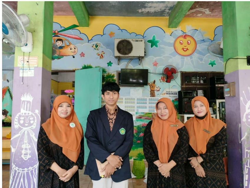
Gambar 5. Wawancara Bersama Para Guru Selaku Panitia Zakat Di Yayasan Ya Bunaiya