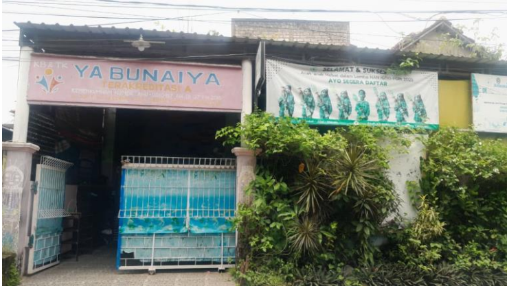
Gambar 1. Yayasan Ya Bunaiya Tampak Depan