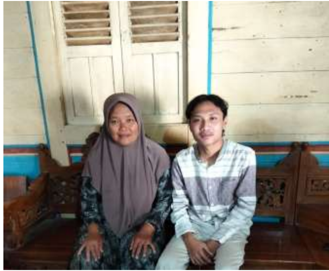
Wawancara dengan Ibu Padni Selaku Orangtua Pelaksana Tradisi Tuntunan