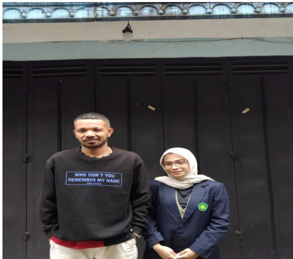
Dokumentasi wawancara dengan pelaku paru dheko