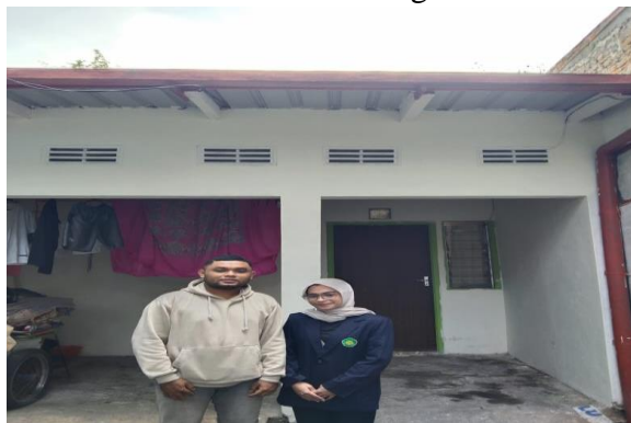
Dokumentasi wawancara dengan Karang Taruna