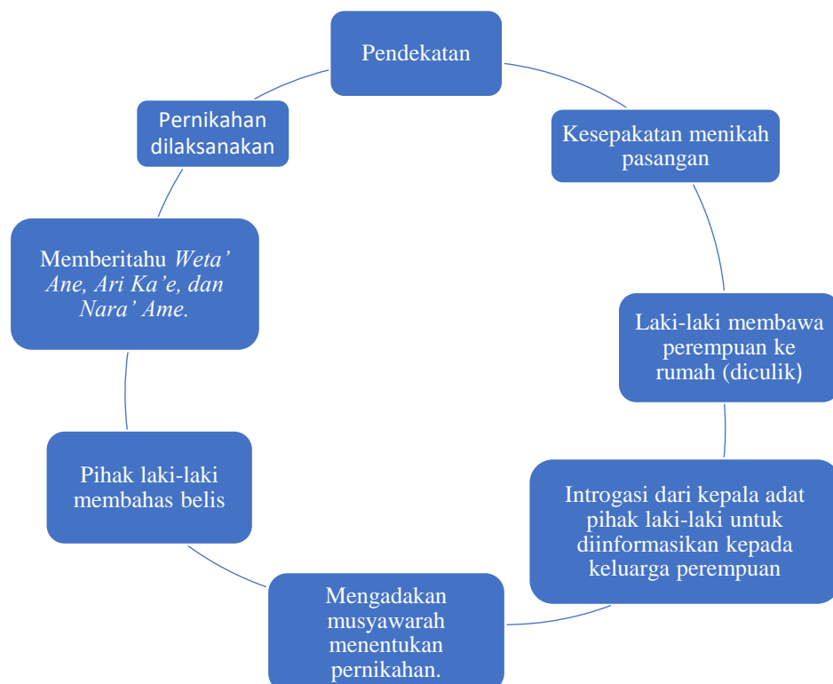
Gambar 1 Pola Tahapan Paru Dheko