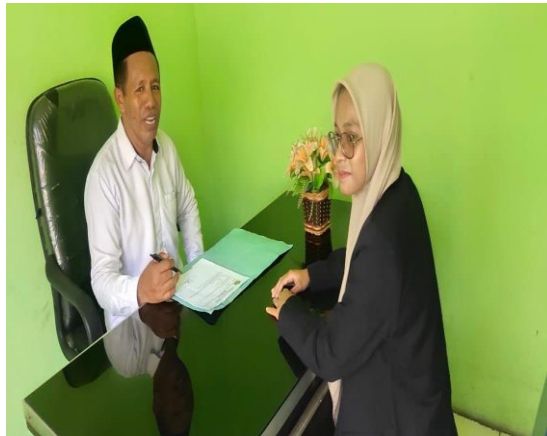
Dokumentasi wawancara dengan Lurah Ende Utara