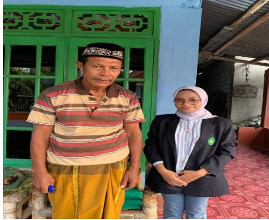
Dokumentasi wawancara dengan Ketua Adat