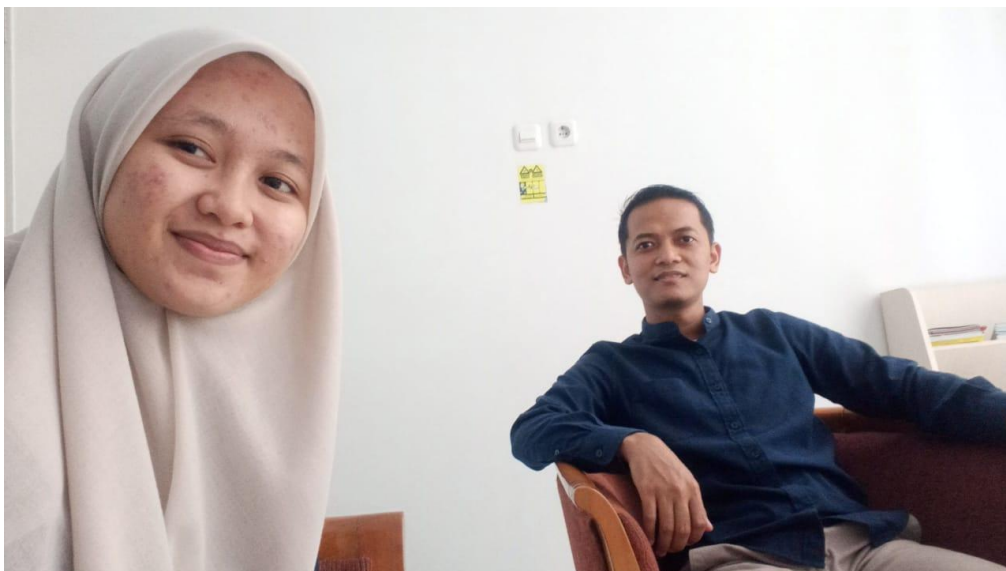
Wawancara dengan Branch Sales Support BMI KC Malang