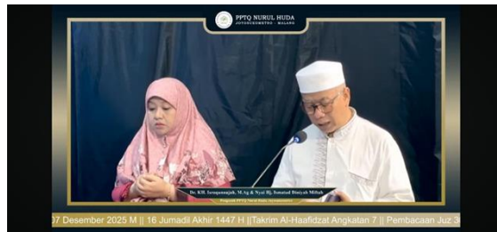
Foto Pengasuh PPTQ. Nurul Huda