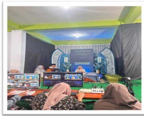
Foto salah satu kegiatan wajib tahunan di PPTQ. Nurul Huda yakni Takrim