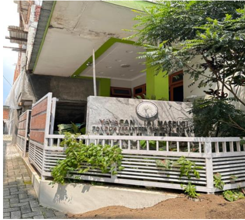
Foto pondok PPTQ. Nurul Huda