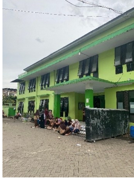
الصورة (١): سكن اللغة العربية