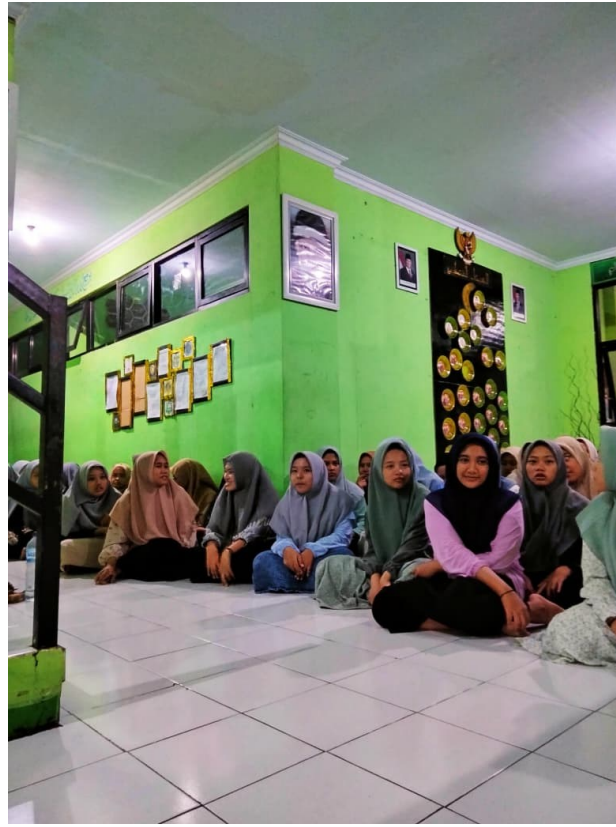
الصورة ٤,٥: نشاط الانشاء في سكن اللغة العربية

وفيما يلي نشاط الانشاء في سكن اللغة العربية: