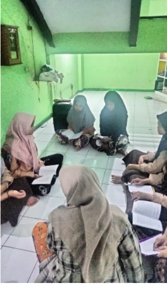
الصورة (٢): البرنامج اليومي (التخصص)