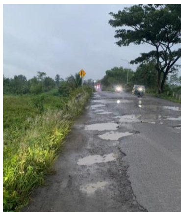
Gambar 3. Dokumentasi Jalan Rusak di Sekitar tambang Pasir

Mekanisme partisipasi masyarakat dalam proses perizinan tambang sirtu di Kabupaten Blitar belum berjalan sebagaimana mestinya. Berdasarkan hasil wawancara dengan Bapak Setiyawan, warga yang bertempat tinggal di kawasan pertambangan, diketahui bahwa masyarakat sekitar tidak pernah mendapat pemberitahuan atau sosialisasi resmi dari pemerintah maupun pihak penambang sebelum kegiatan tambang beroperasi di wilayah mereka. Ketiadaan sosialisasi ini menjadi hambatan serius karena perizinan yang dilakukan secara teknis-administratif tanpa disertai upaya pelibatan masyarakat berpotensi menimbulkan konflik sosial di lapangan.