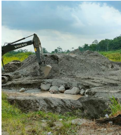
Gambar 2. Aktivitas Penambangan Pasir (Sirtu) di Kabupaten Blitar