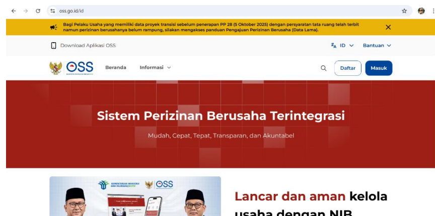
Gambar 2. Tampilan Beranda Website Online Single Submission Risk-Based Approach (OSS RBA)

Keberadaan sistem Online Single Submission Risk-Based Approach (OSS RBA) yang diatur melalui Peraturan Pemerintah Nomor 28 Tahun 2025 tentang Penyelenggaraan Perizinan Berusaha Berbasis Risiko menjadi faktor pendukung penting dalam penataan tata ruang wilayah. Sistem OSS RBA menjadi platform tunggal perizinan berusaha yang mengintegrasikan seluruh proses dari tingkat pusat hingga daerah, termasuk mekanisme penilaian Kesesuaian Kegiatan Pemanfaatan Ruang (KKPR). Sistem ini memberikan kepastian hukum dan kepastian waktu bagi pelaku usaha, di mana batas maksimal pengurusan KKPR Perusahaan adalah sekitar 30 hingga 35 hari kerja.