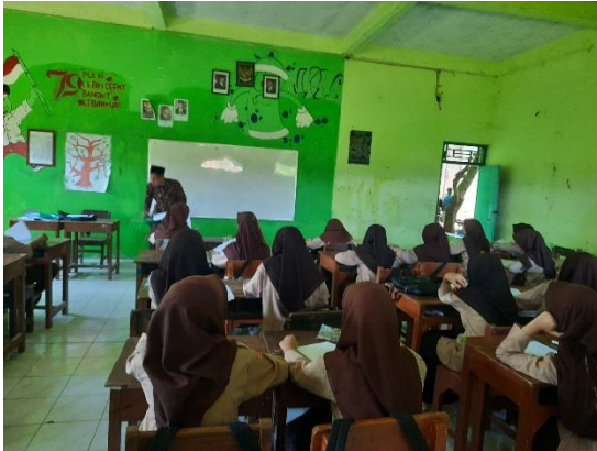
الاختبار البعدي للفصل الضابطة