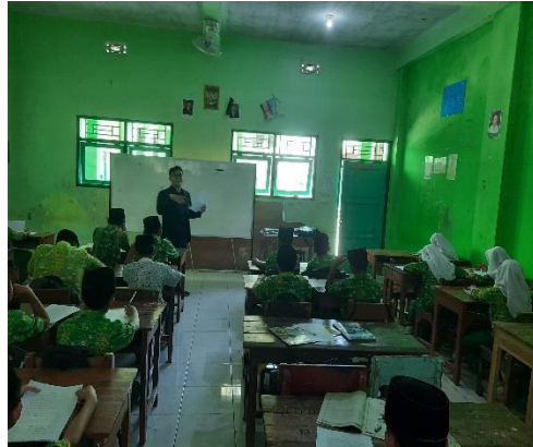
الاختبار البعدي للفصل التجريبية