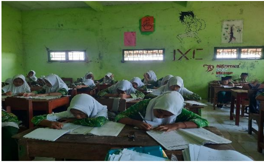
عملية التعلم للفصل الضابطة