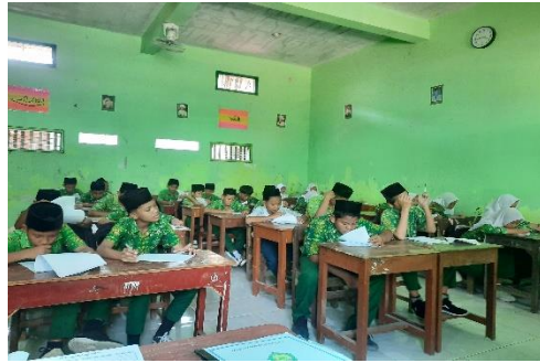
عملية التعلم للفصل التجريبية