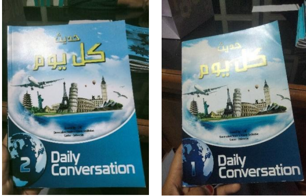
الصورة : كتاب المحادثة اليومية المستخدم

لوجها مع زملائها الطالبة فيما تتعلق بالمفردات التي حصلت عليها من قبل. يتم تنفيذ هذا النشاط ميدانياً مثل زيادة مفردات وتشرف عليه الأستاذات.