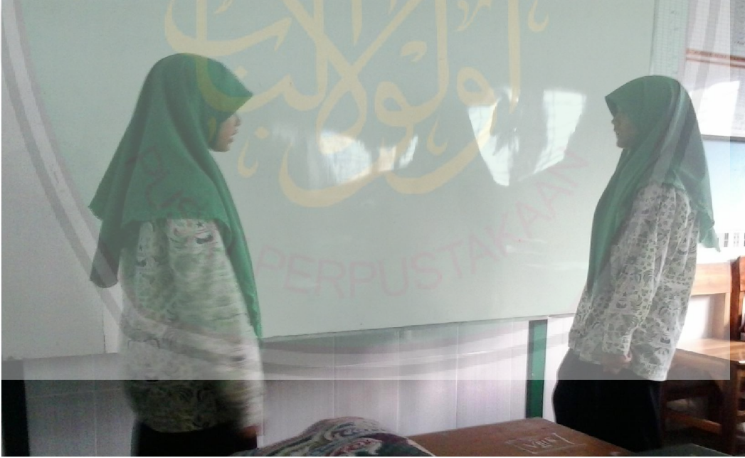
صورة الطلبة حين القيام باختبار الحوار أو الاختبار الشفهي