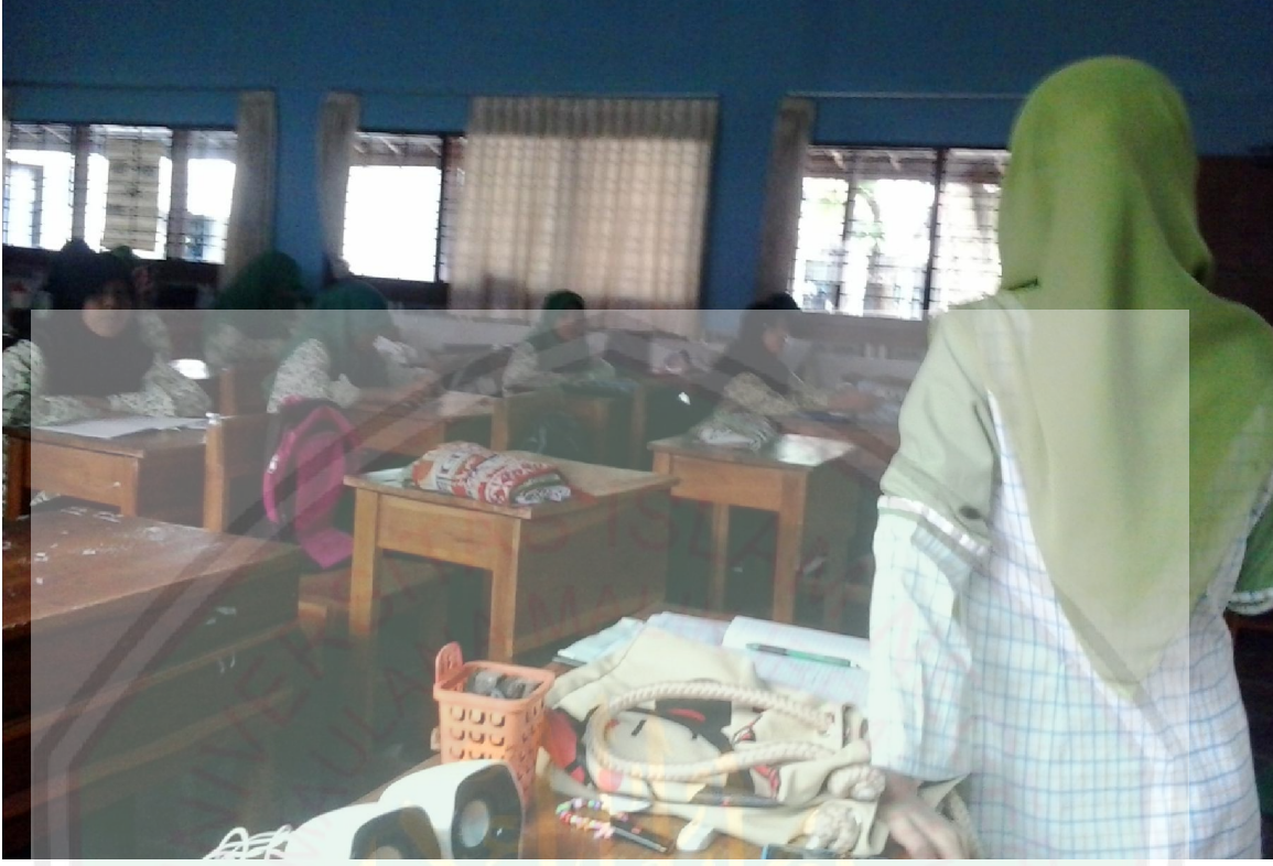
صورة عملية التجربة