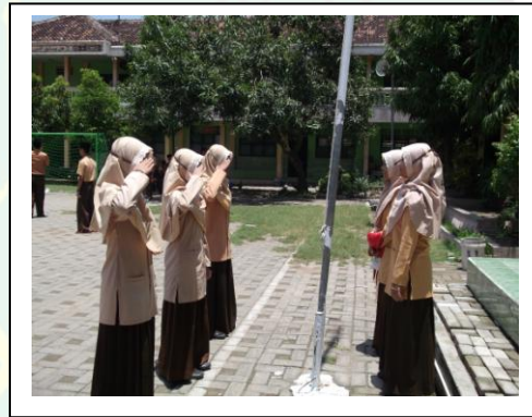
تدريبات المراسم الأسبوعي