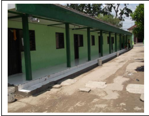
حجرة معهد الرشيد للبنين