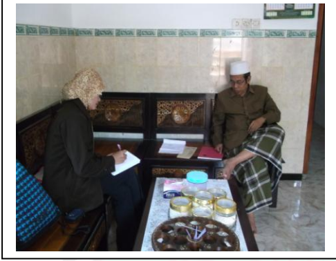
مقابلة مع الرئيس المعهد