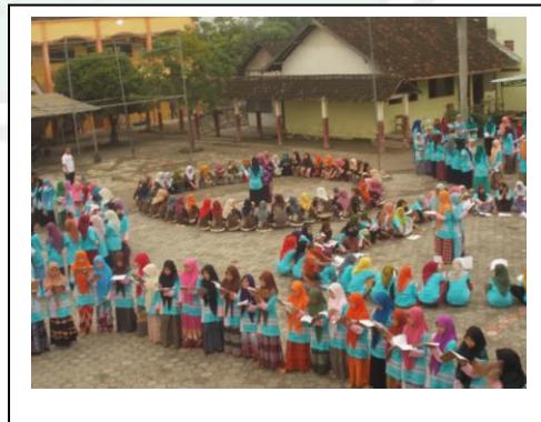
محادثة قبل الرياضة