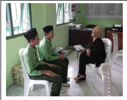
مقابلة مع الطالب