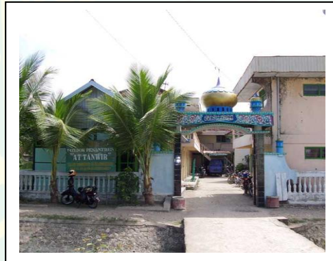
مقام مؤسس معهد التنوير