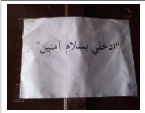
كتابة باللغة العربية امام الباب