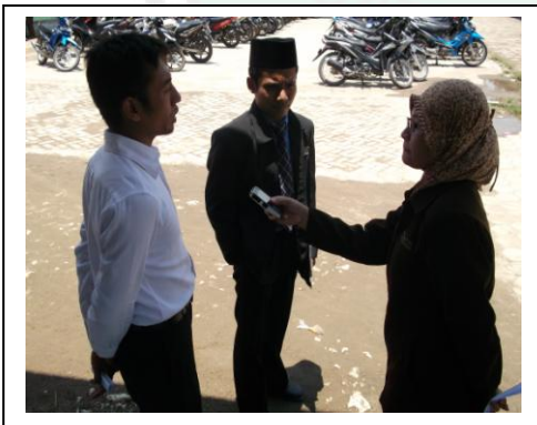
مقابلة مع الأستاذ معهد الرشيد