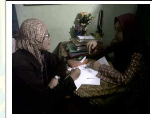
مقابلة مع الطلبة