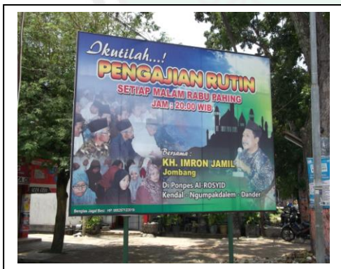
البرنامج الأسبوعي مع المجتمع