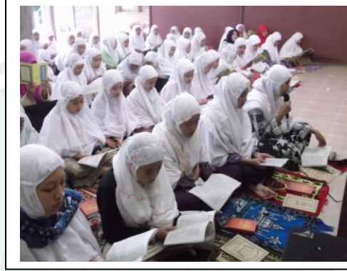
قراءة الكتب جماعة