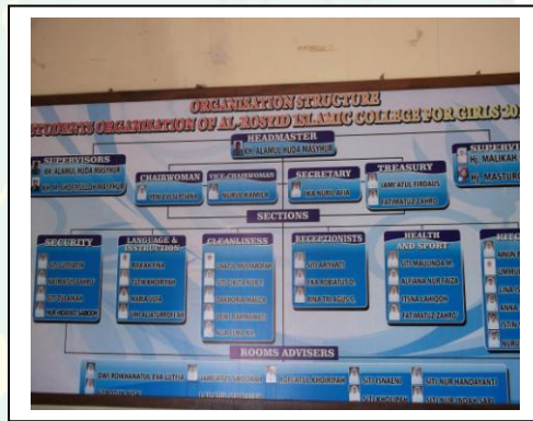
قسم منظمة الطالبة للبنات