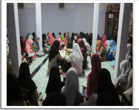
قراءة الشعر في المسجد جماعة