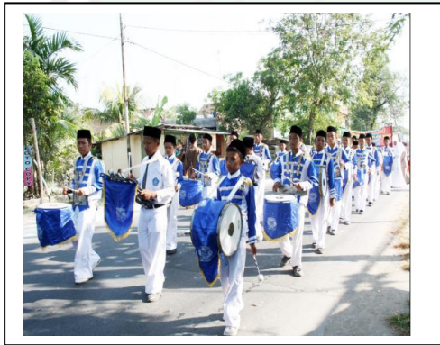
فرقة الطبول معهد الرشيد