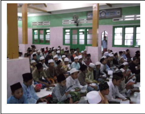
قراءة الكتب جماعة