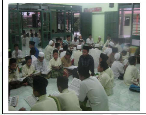
قراءة القرآن في المسجد كل الجحرة