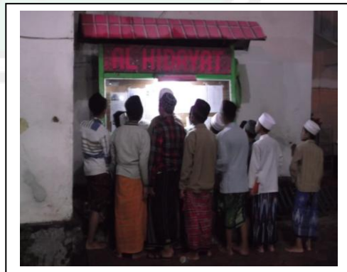
قراءة الطلاب بعض الإعلانات