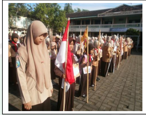
الأنشطة الطلاب "كشافة" للبنين