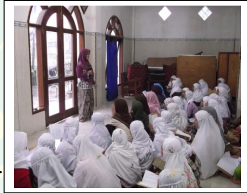
محاورة مساء جماعة