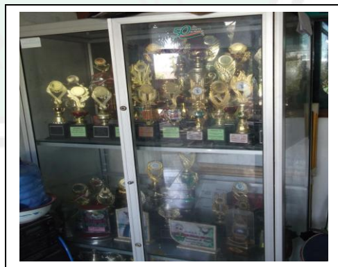
الكؤوس معهد الرشيد