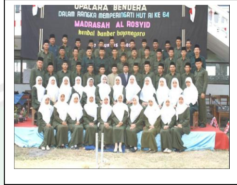
المدرسين والمدرسات بمعهد الرشيد