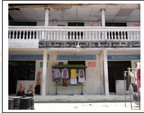
حجرة معهد الرشيد للبنات