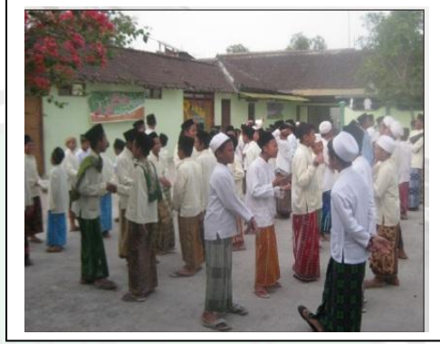
المحادثة صباحية معهد الرشيد للبنين