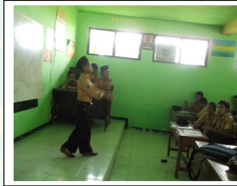
الخطابة لطلاب معهد الرشيد في الفصل