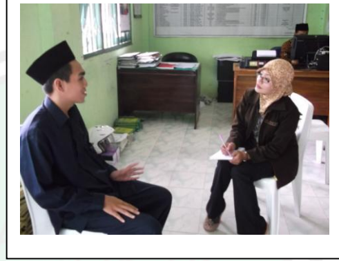
مقابلة مع الأستاذ