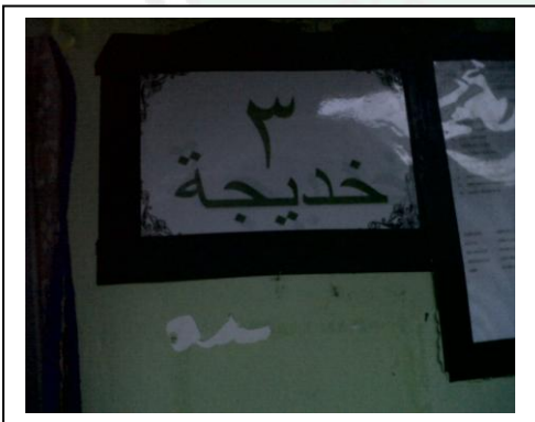
لوحة اللغة كل الحجره