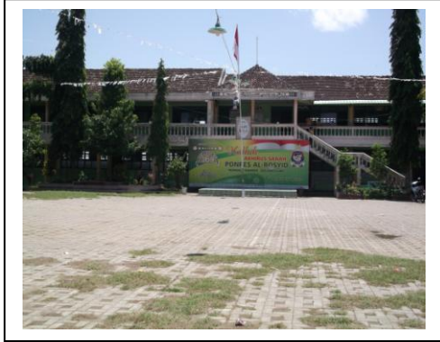
الصورة الفصول صباحية