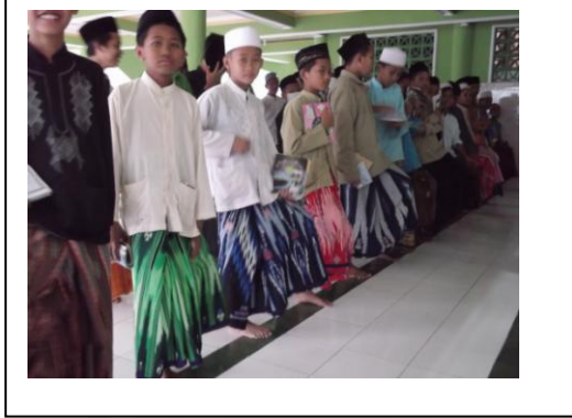
عقاب من متأخرة في التباء محاورة مساء