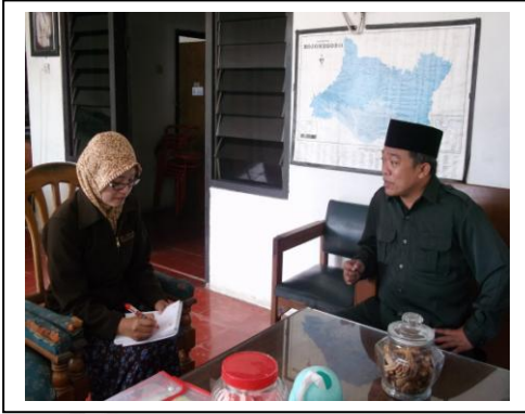
مقابلة مع الرئيس المعهد الرشيد