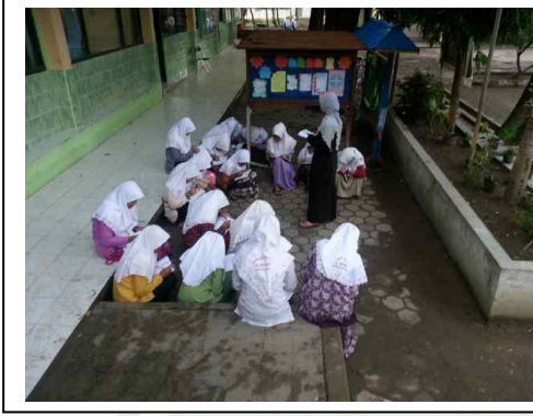
محادثة صباحية معهد الرشيد للبنات