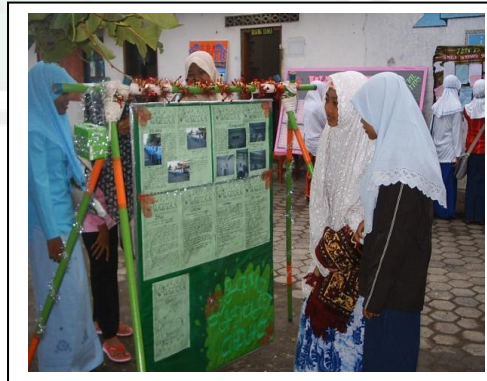
قراءة الطلبة المجلة الحائطية