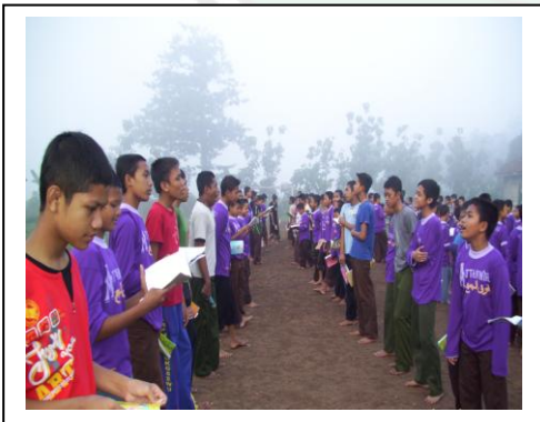
محادثة قبل الرياضة