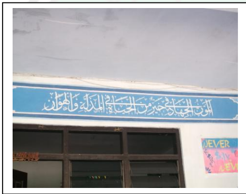
لوحة الشعار باللغة العربية