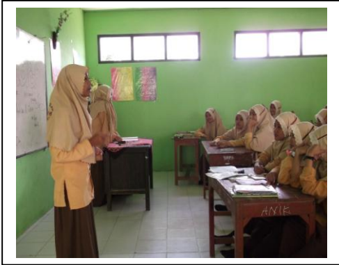
الخطابة لطلاب معهد الرشيد في الفصل