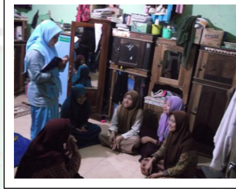
مخاورة في الحجرة قبل النوم كل ليل