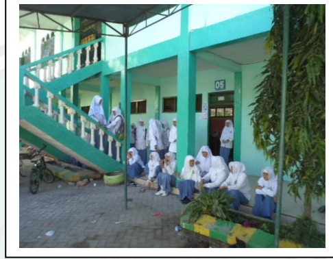
حل الطلبة أمام الفصل عملية مراسيم مدرسة التنوير