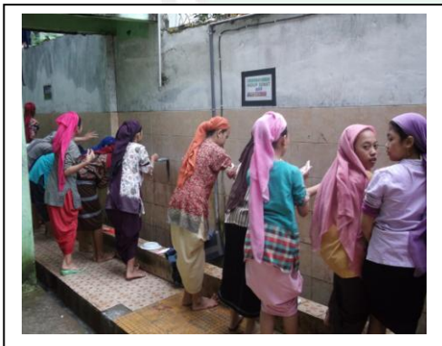
وضوء الطلبة قبل الصلاة