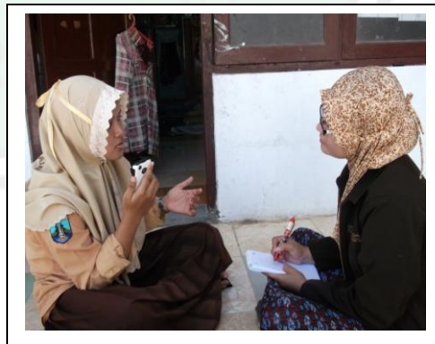
مقابلة مع الطلبة معهد الرشيد