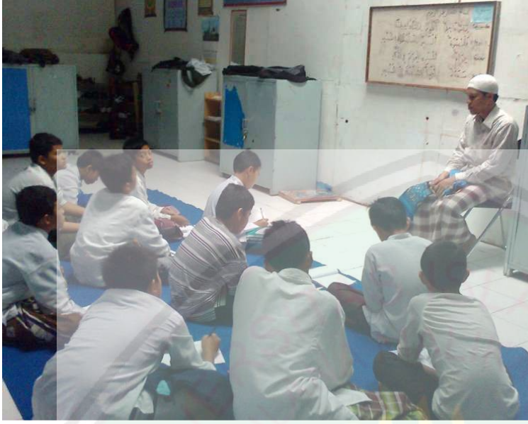
الرسم ٤ الباحث مع الطلاب أثناء العملية التعليمية