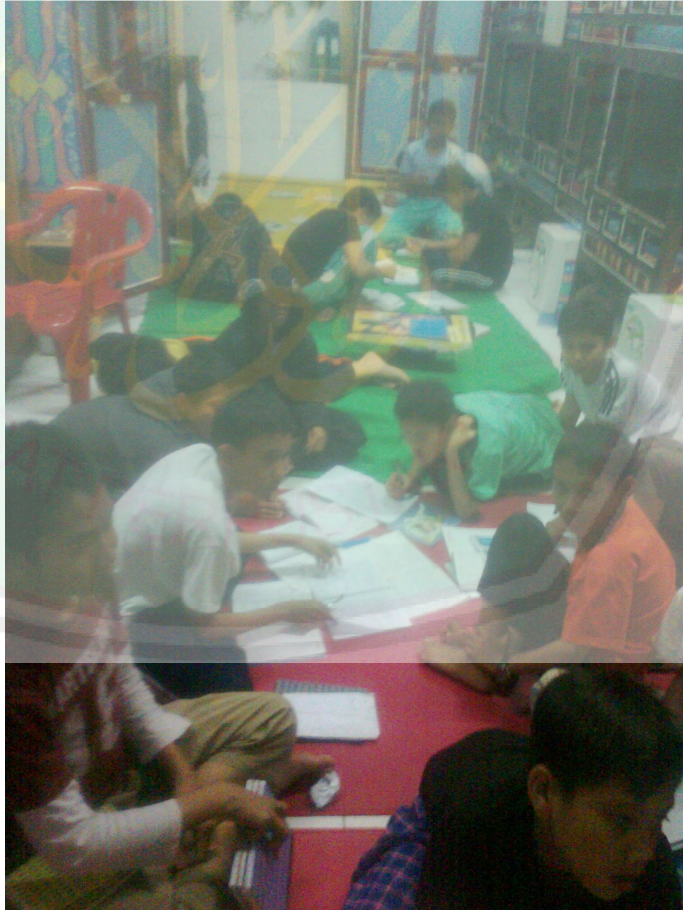
الرسم ٥ طلاب المجموعة الضابطة أثناء العملية التعليمية للمدرس المفردات