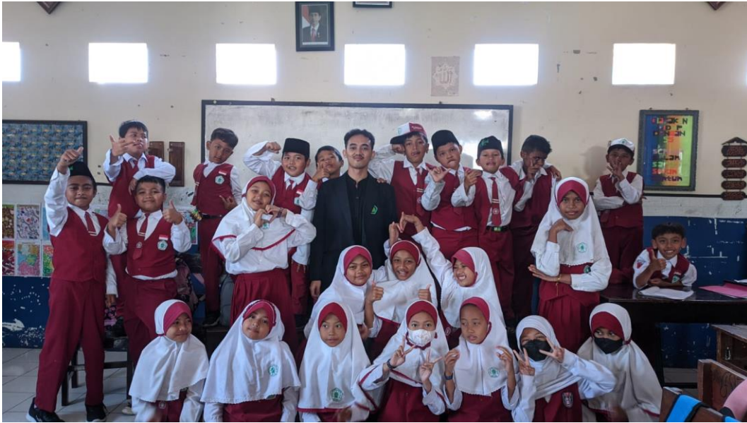
Foto Bersama Seluruh Siswa Kelas III