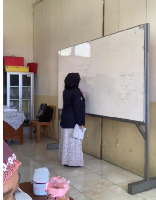
صورة 1: الأنشطة البحثية في الصف ٥ ج