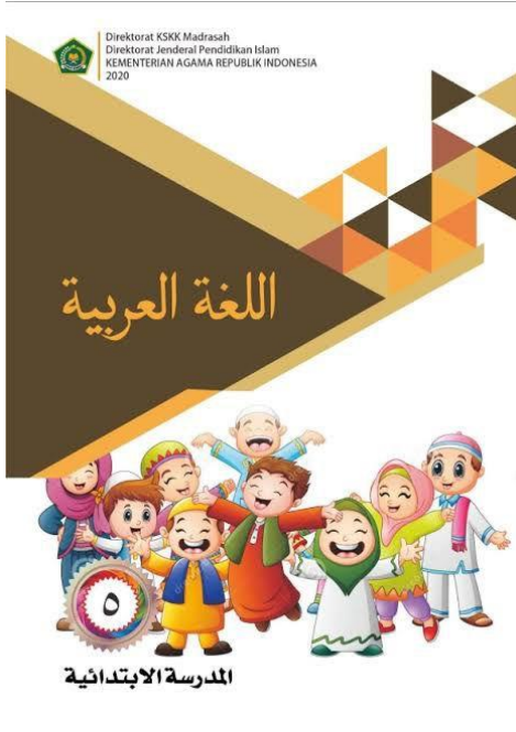
صورة 2: كتاب اللغة العربية في مدرسة بستان العلوم الابتدائية باتو