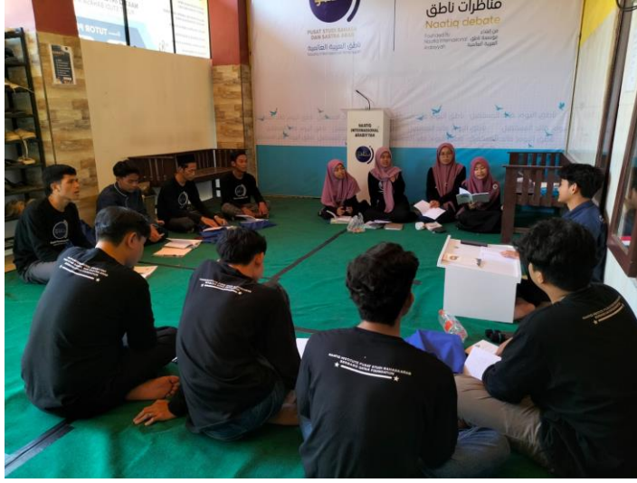
برنامج مع الإخوة