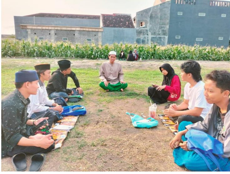
عملية تعليم الإنشاء