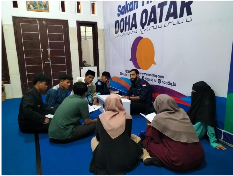
عملية تعليم نقاش العلم