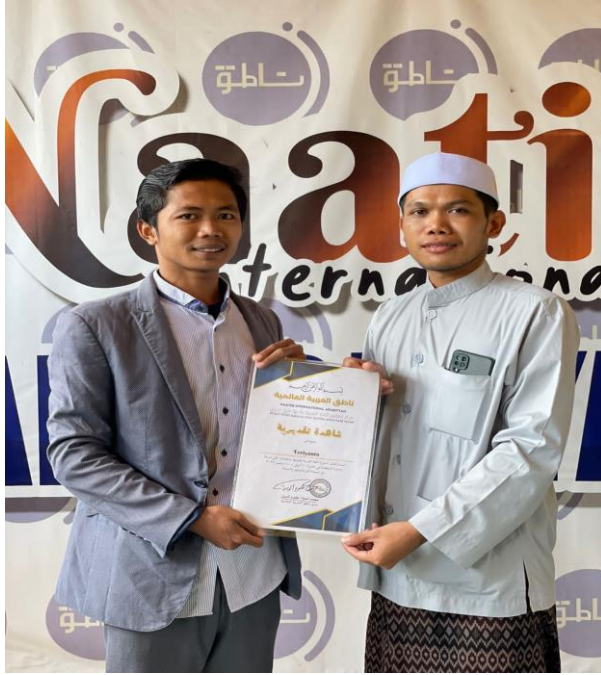
مع مدير الدورة