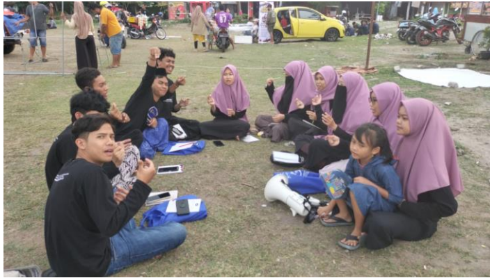
تعليم في الميدان