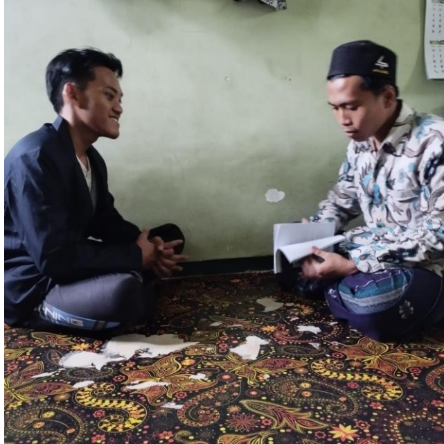
المقابلة مع الطالب