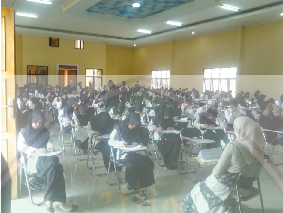
Suasana tenang saat mengikuti ujian tertulis yang dilaksanakan secara bersamaan di aula kampus