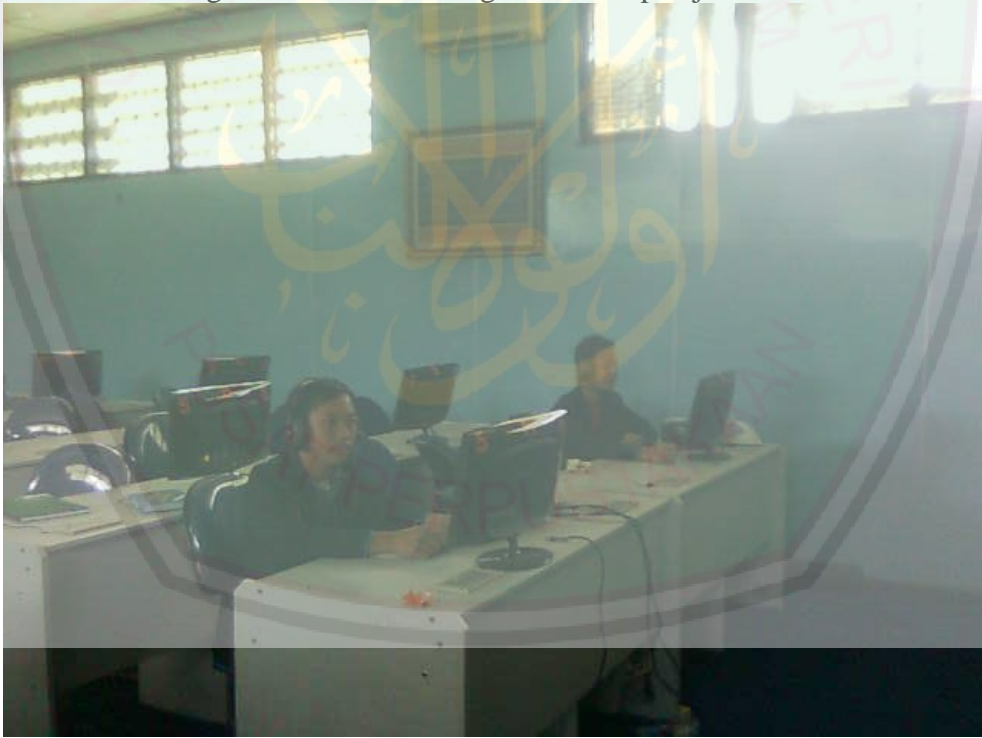
Mahasiswa sedang belajar di Lab. Bahasa