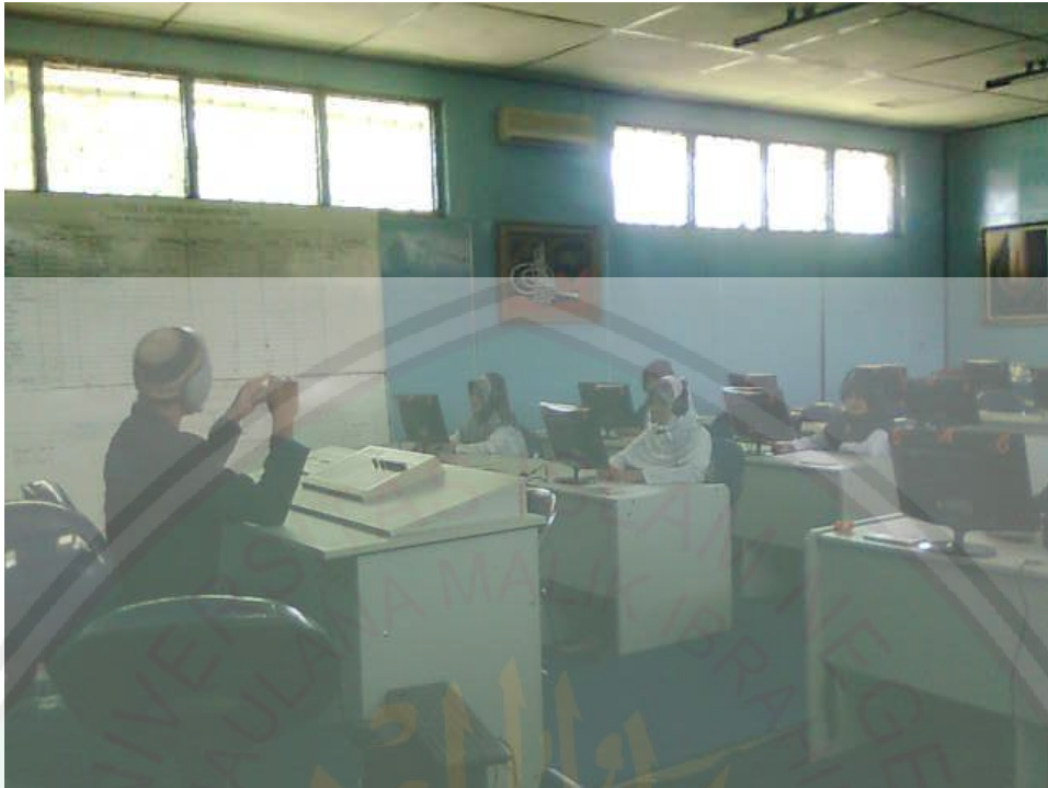
Mahasiswa dan dosen sangat antusias melaksanakan pembelajaran di Lab. Bahasa