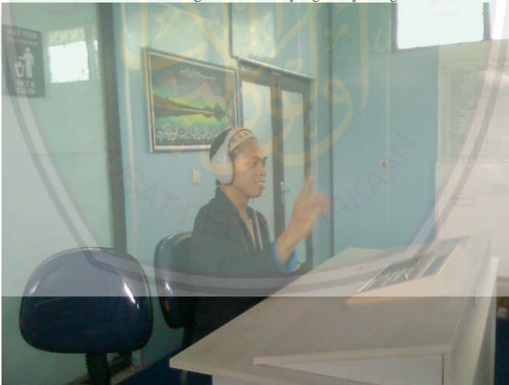
Seorang dosen begitu bersemangat mengajar mahasiswa di Lab. Bahasa