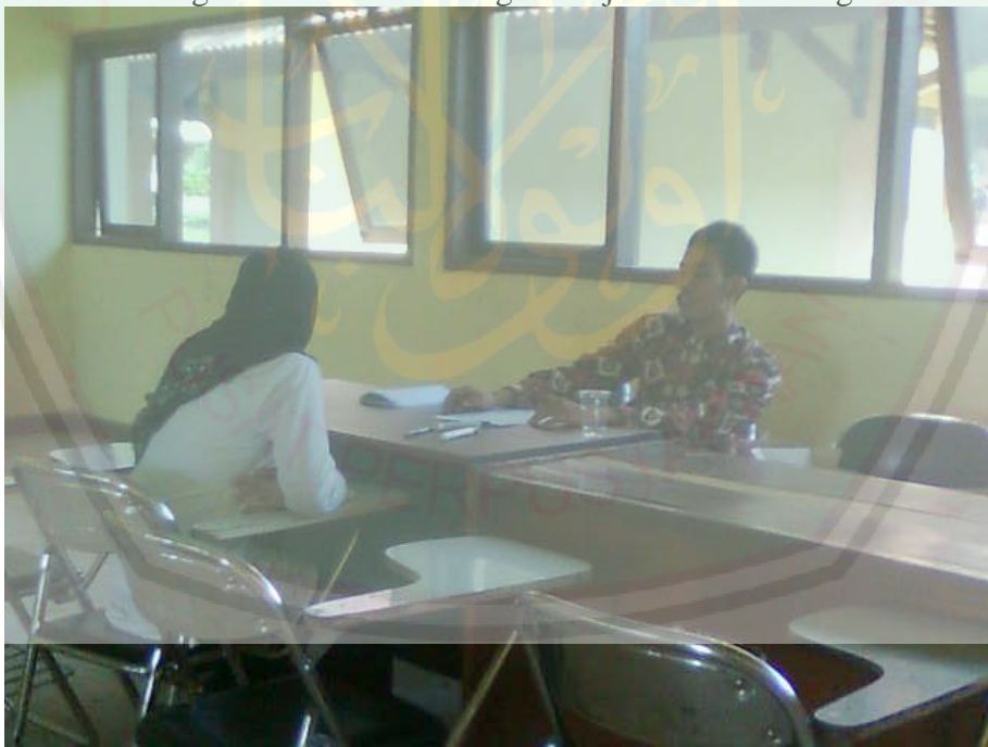
Seorang mahasiswi sedang mengikuti ujian tulis di ruang kelas