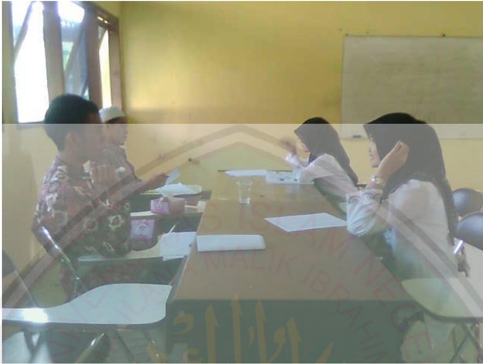
Dua orang mahasiswi saat mengikuti ujian lisan di ruang kelas