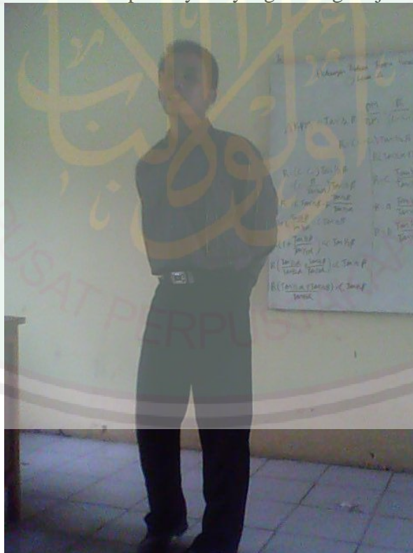
Seorang dosen menerangkan materi pelajaran di depan kelas