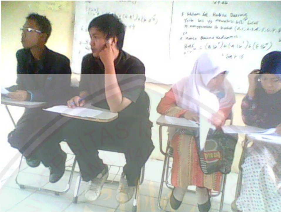
Mahasiswa mencoba mencermati pertanyaan yang sedang diajukan saat berdiskusi ma