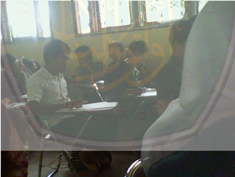
Suasana kelas saat belajar, santai tapi tetap serius