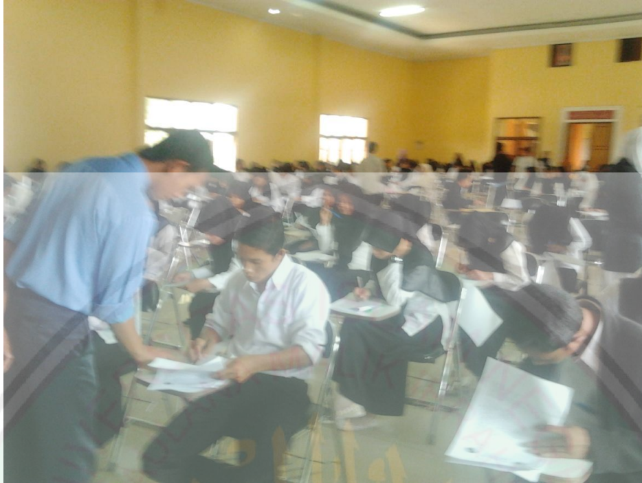
Pengawas memberi instruksi kepada salah seorang mahasiswa saat sedang berlangsung ujian tulisan akhir tahun