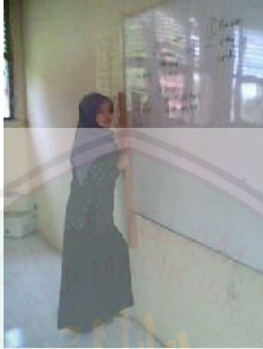
seorang dosen saat menerangkan materi pelajaran di kelas