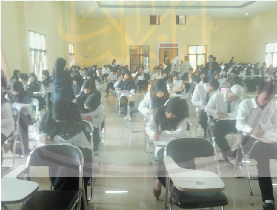
Suasana ujian tulisan akhir tahun bagi mahasiswa dan mahasiswai Ma'had Al-Jamiah IAIN Sulthan Thaha Saifuddin Jambi