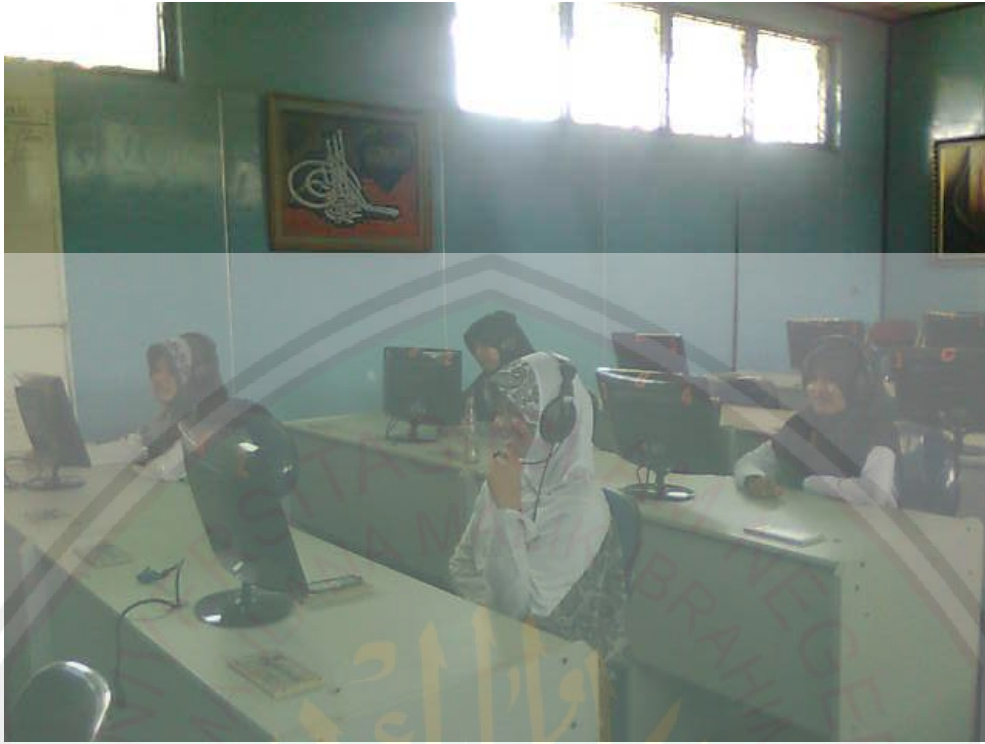
Suasana di ruang Lab. Bahasa yang menyenangkan