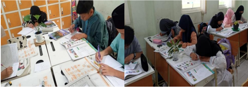
الصورة ١.٤ عملية استخدام استراتيجية المواهب المتعددة لتعليم مهارة الكتابة

المبحث الأول : عملية استخدام استراتيجية المواهب المتعددة لتعليم مهارة الكتابة في المدرسة الابتدائية الحكومية الثانية مالانج