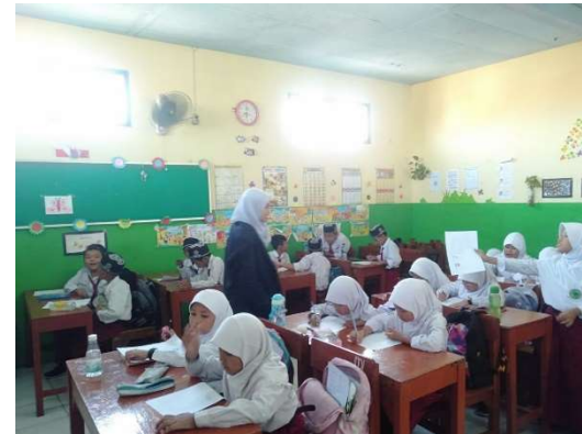
الاختبار البعدي للفصل الضابط