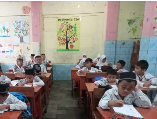
الاختبار البعدي للفصل التجريبي