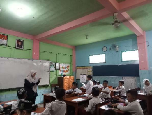
الاختبار القبلي للفصل التجريبي