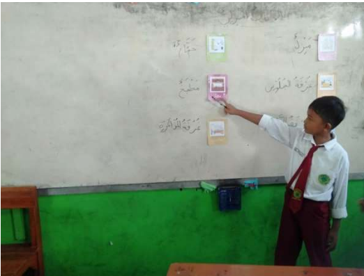
التعليم في الفصل التجريبي