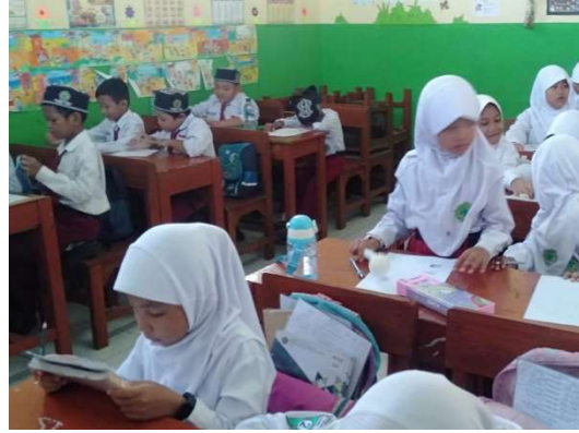
الاختبار القبلي للفصل الضابط