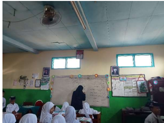
التعليم في الفصل الضابط