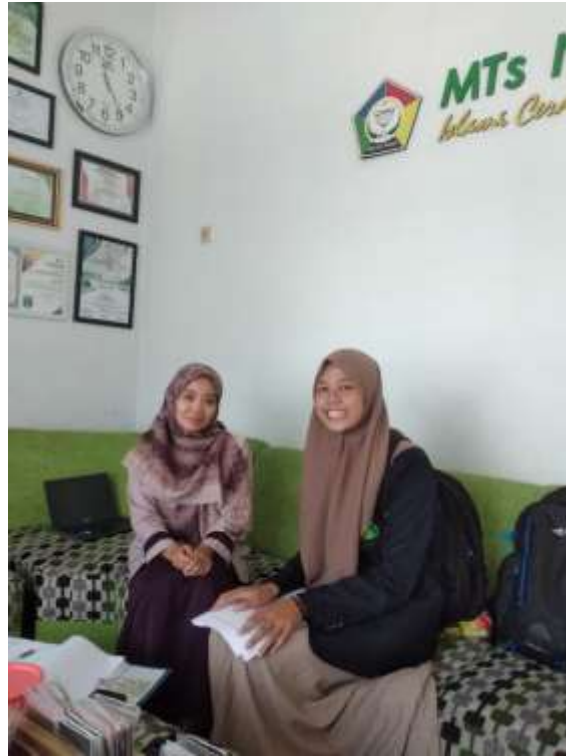
أعطى المدرس نتائج لمهارات اللغوية للباحث