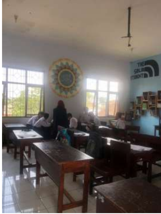
الطلاب يجيبون الاستبانة