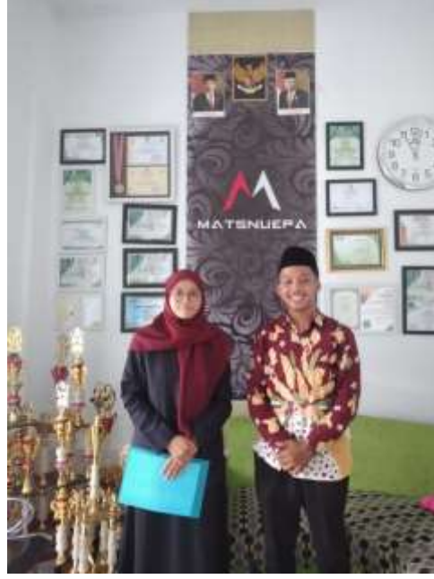
استأذن الباحث للبحث في مدرسة المتوسطة الإسلامية نهضة العلماء فاكيس