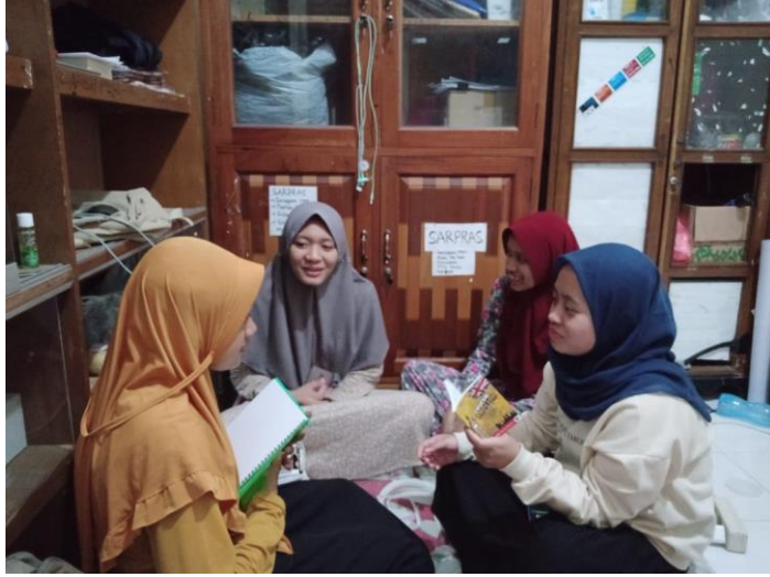
١.١ الصورة الإنتشارية