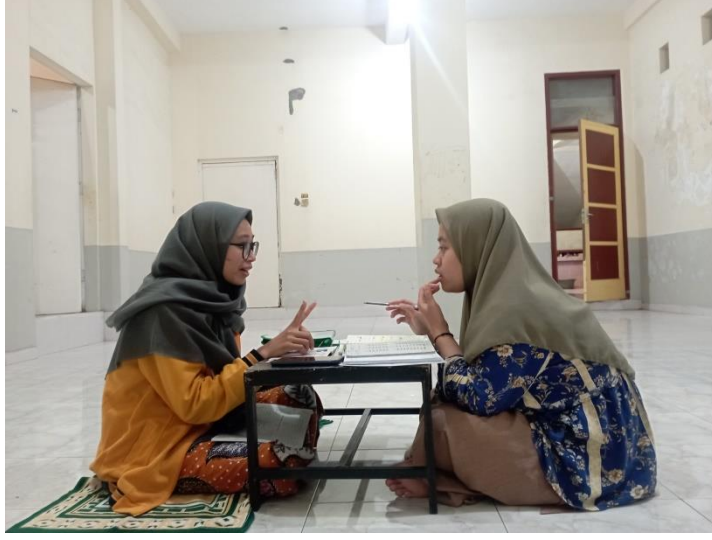
١.٢ الصورة الانتشارية

العربية. وكثيرا ما أسأل المعلم، وأحيانا حتى أحد المشرفة ١٧٩