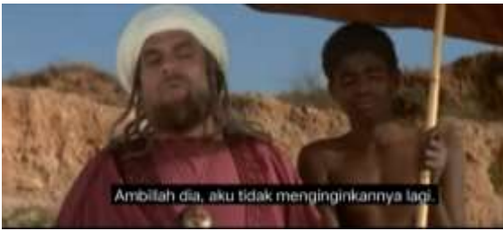
صورة ١،٩ الكياسة الإيجابية (فهم الرغبات)

الجملة خذه لا حاجة به إلي هي جملة تدل على الكياسة الإيجابية التي تحدث بها عمية إلى عمار عندما جاء عمار وعرض بلال بثمن ٢٠٠ دينار على عمية، فقال عمياه فخذه،