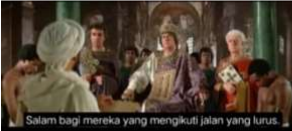
صورة ٢٥، الكياسة السلبية (الاحترام)

تقع الجملة في جملة تخفيف العبء لأنها تعني أنه من خلال فهم السبب وراء طلب النبي بمغادرة مكة، يمكن تقليل العبء أو القلق الذي يشعر به الناس. من خلال إدراك أن الوضع في مكة ليس آمناً، يمكن للناس أن يشعروا بالارتياح أو الارتياح من عبء عدم اليقين أو الخطر الذي قد يحدث إذا بقوا هناك. لذلك، تعمل الجملة على تقليل العبء العاطفي أو الجسدي الذي قد يشعر به المستمع أو القارئ. يتماشى هذا الخطاب مع كلمات براون وليفنسون، حيث تتناسب جملة السؤال مع استراتيجية الكياسة السلبية الموجهة إلى الوجه السلبي لشريك الكلام (براون وليفنسون، ١٩٨٧). ٢٥. سلام على من اتبع الهدى (١٣: ٢٠)