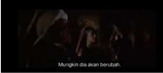
صورة ٢،٢ الكلام الزائف الذي نطق به أبو لهب

الجملة ربما يتغير هي جملة زائفة التي نطق بها أبو لهب لزوجته المسماة أم جميل. هذه الجملة قالها أبو لهب عندما كان يتحدث عن النبي محمد مع زوجته، حيث اعتبر أبو لهب أن النبي محمد قد يتغير.