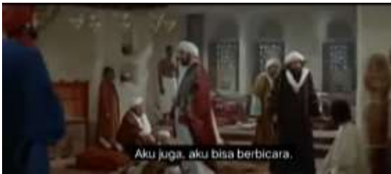
صورة ١،٧ الكياسة الإيجابية (إظهار التشابه)