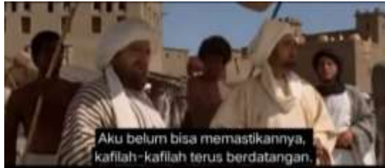
صورة ٢،١ الكلام الزائف الذي نطق به عميرة

٢،١. لم تتضح بعد، فالقوافل مازال تطور (٠١:٣٧)