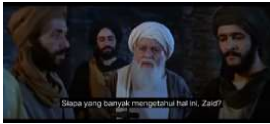
صورة ٢،٢ الكياسة السلبية (الأسئلة)

الجملة ومن عرف ماتعرف يا زيد هي جملة تدل على الكياسة السلبية التي تحدث بها أبوطالب لزيد عندما يروي زيد