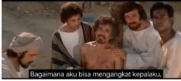
صورة ٢٠٦ الكياسة السلبية (المغفرة)

٢٠٦. يا رسول الله كيف أرفع رأسي في حضرتك وقد نلت منك (٣٣:٥٠)