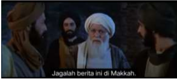
صورة ٢٠٧ الكياسة السلبية (التخصيص)

٢٠٧. احذر أن تعلن هذه الأخبار في مكة (١٧:٥٣)