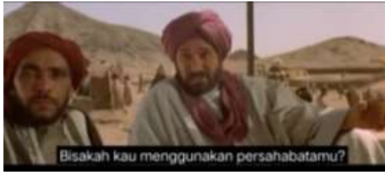
صورة ٢٤١ الكياسة السلبية (التعبيرات غير المباشرة)

٢٤١. هل في وشيك أن تستغل هذه الصداقة (٥٦:١٩)