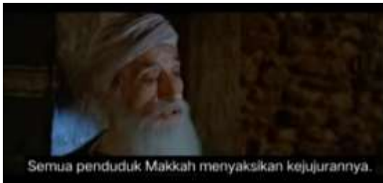
صورة ١،٦ الكياسة الإيجابية (تجنب المعارضة)

١،٦ . مكة كلها تشهد أنه صادق الأمين (٢٢:٥٧)