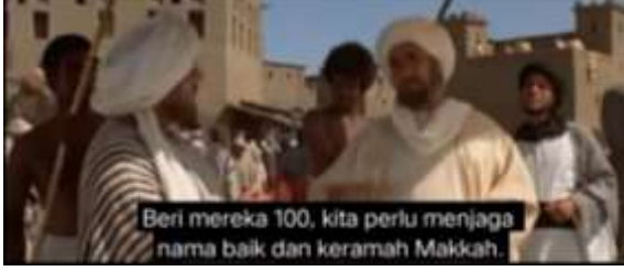
صورة ١، الكياسة الإيجابية (إيلاء الإهتمام)

الجملة اجعلها مئة واحفظ لمكة هيبتها هي جملة تدل على الكياسة الإيجابية التي تحدث بها أبو سفيان لعميره. عندما كانوا يراقبون حالة السوق جاءت قافلة الشام، التي اهتم فيها أبو سفيان بقافلة الشام حتى ذبح عميرة ١٠٠ خروف لتعطى لقافلة الشام، حفاظا على اسم مكة ورائحتها.