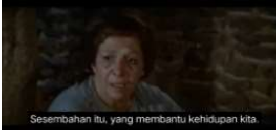
صورة ١،٢ الكياسة الإيجابية (المبالغة في الإهتمام)

التي تقول في بحثها أن الثناء أو الاهتمام هو شكل من أشكال استراتيجية الكياسة الإيجابية (صدى وآخرون، ٢٠٢٣). ١،٢. هذا اله منحنا عونهُ طول الحياة (٢٢:١٢)