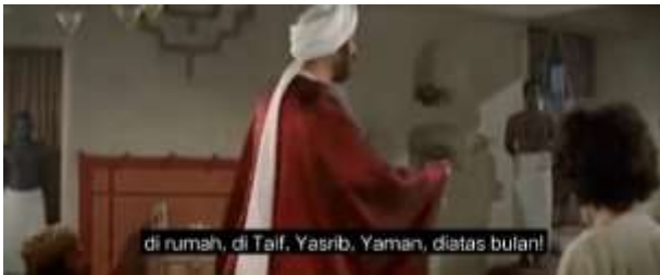
صورة ١،٨ الكياسة الإيجابية (إستخدام النكات)

١،٨. أنتم تقولون أنه في كل مكان هنا، في بيتي، في الطائف في يثرب في يمان فوق القمر (٢٦:٥٨)