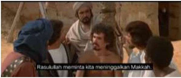
صورة ٢٤، الكياسة السلبية (تقليل الأعباء)

الجملة أمرنا رسول الله أن نترك مكة هي جملة تدل على الكياسة السلبية الذي تحدث بها صحابة النبي إلى عمار والآخرون عندما رأى النبي حالة المسلمين الذين لم يعودوا آمنين إذا بقوا في مكة. كان الحكم هو إخبار المسلمين بمغادرة مكة على الفور، بسبب الوضع غير الآمن بعد وفاة والد عمار ووالدته المعذبين اللذين قتلوا بعد ذلك على يد قريش أمام أعين عمار.