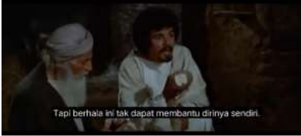
صورة ٢،٣ الكياسة السلبية (التشاؤم)

الجملة ولكنه لم يمنح نفسه عونه هي جملة تدل على الكياسة السلبية التي تحدث بها عمار لوالديه عندما أسقط عمار بطريق الخطأ صنما في منزله وتم تدميره، وكان والده خائفاً لأن الإله الذي كان يعبدته قد دمر وقالت والدة عمار إنه إذا كان المعبود هو ما ساعد حياته طوال هذا الوقت، قال عمار إنه إذا تم تدمير هذا المعبود فلن يتمكن من مساعدة نفسه.