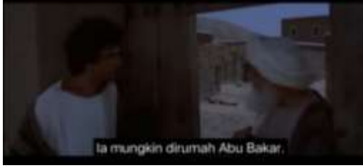
صورة ٢،٣ الكلام الزائف الذي نطق به أبو طالب

الجملة لعله في بيت أبي بكر هي جملة زائفة التي قالها أبو طالب عم النبي لزيد. عندما سأل زيد عم النبي عما إذا كان النبي محمد قد نزل من غار حراء، أجاب أبو طالب بكلمة ربما، والتي اعتبرها أبو طالب أنه ربما كان النبي محمد في بيت أبي بكر. يمكن اعتبار عبارة "لعله في بيت أبو بكر" جملة زائفة إذا لم تكن هناك معلومات كافية لدعم الادعاء. تشير الجملة إلى أن هناك احتمالا بأن شخصا ما كان في منزل أبو بكر، لكن لا