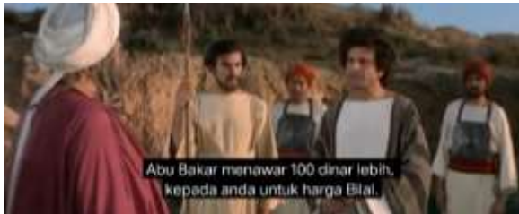
صورة ١٠، ١ الكياسة الإيجابية (العرض أو الوعد)

١٠، ١. أبو بكر يزيدكم مئة دينار على ثمن بلال (٣١:٠٢)