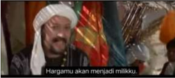
صورة ١٠٥ الكياسة الإيجابية (إظهار الموافقة)

الجملة خذي بما شئت يا مولاتي هي جملة تدل على الكياسة الإيجابية التي تحدث بها التاجر إلى زوجة أبو سفيان، وقد قيلت هذه العبارة في السوق عندما عرضت زوجة أبو سفيان القماش الذي أراد شراءه، والذي قال التاجر إنه أخذه كما يخلو لك، مما يشير إلى اتفاق بين تاجر القماش وزوجة أبي سفيان.