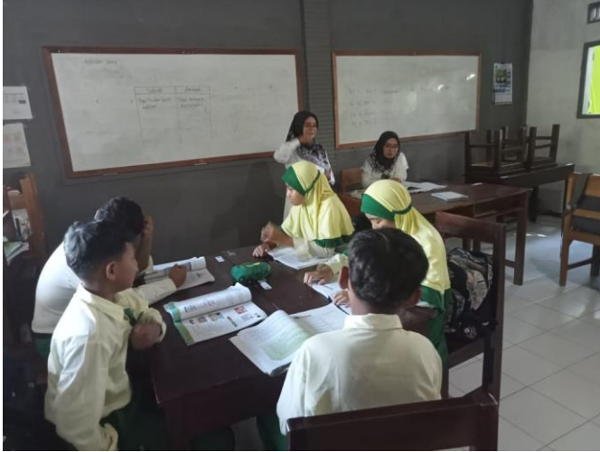
الصورة ٢ - تصميم تخطيط Project Based Learning

في المرحلة الثانية، وهي تصميم تخطيط المشروع، يقوم الطلاب بوضع خطوات لإنشاء المشروع وفي نفس الوقت يجهزون الأدوات والمواد التي سيستخدمونها. بعد تحديد الأسئلة الأساسية، يقوم المعلم هنا بتصميم خطة المشروع الذي سيتم إجراؤه أو إنشاؤه. يطلب الباحثة من الطلاب قراءة وفهم الخطوات المتعلقة بإنشاء نموذج ثلاثي الأبعاد في فيديو على قناة YouTube التي تم إرسالها في مجموعة واتساب. يبدأ ذلك من الأدوات والمواد التي يمكن استخدامها لإنشاء المشروع حتى كيفية صنعه.