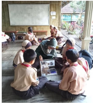
الصورة ٣ - مراقبة التلاميذ لتحسين المشروع

وقد أثبتت نتائج المراقبة ذلك من خلال التوثيق بالصور أثناء أنشطة التعلم في الفصل. وتشمل توثيقات المرحلة الرابعة صورًا توضح تطبيق نموذج التعلم القائم على المشروع كالتالي: