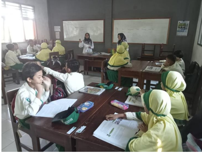
الصورة ١ - عملية التعليم و التعلم اللغة العربية في الفصل الخامس

قامت الباحثة بالمراقبة في صف الخامس مرتين، حيث جرت المراقبة الأولى في ٤ يناير ٢٠٢٤ والمراقبة الثانية في ١٨ يناير ٢٠٢٤، مع متابعة الطلاب أثناء إنجاز مشاريعهم.