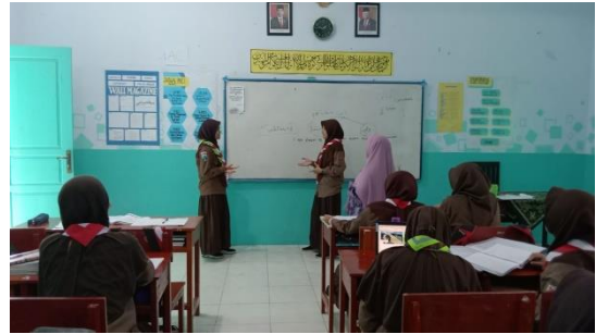
عملية التعليم على HOTS