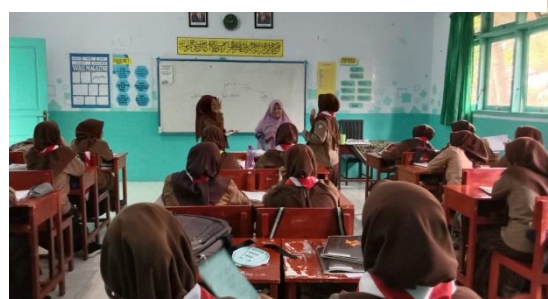
عملية التعليم على HOTS