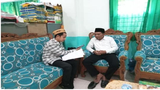
المقابلة مع مدير المدرسة