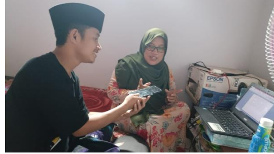
المقابلة مع المعلمة