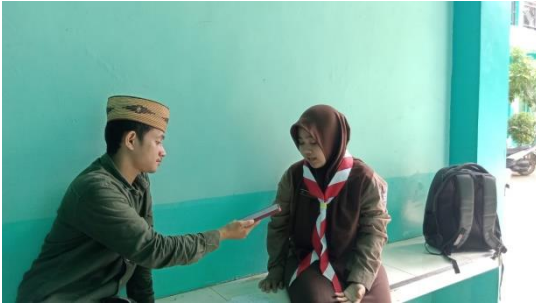
المقابلة مع الطالبة