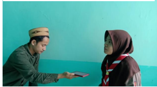
المقابلة مع الطالبة