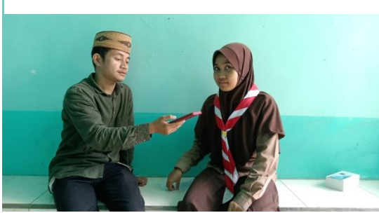
المقابلة مع الطالبة