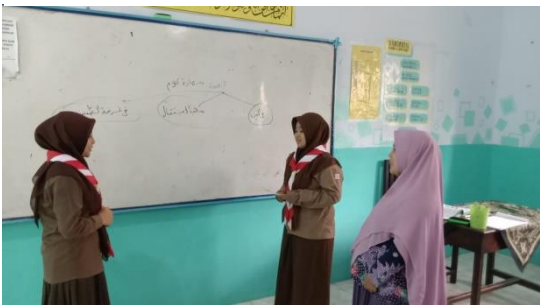
عملية التعليم على HOTS