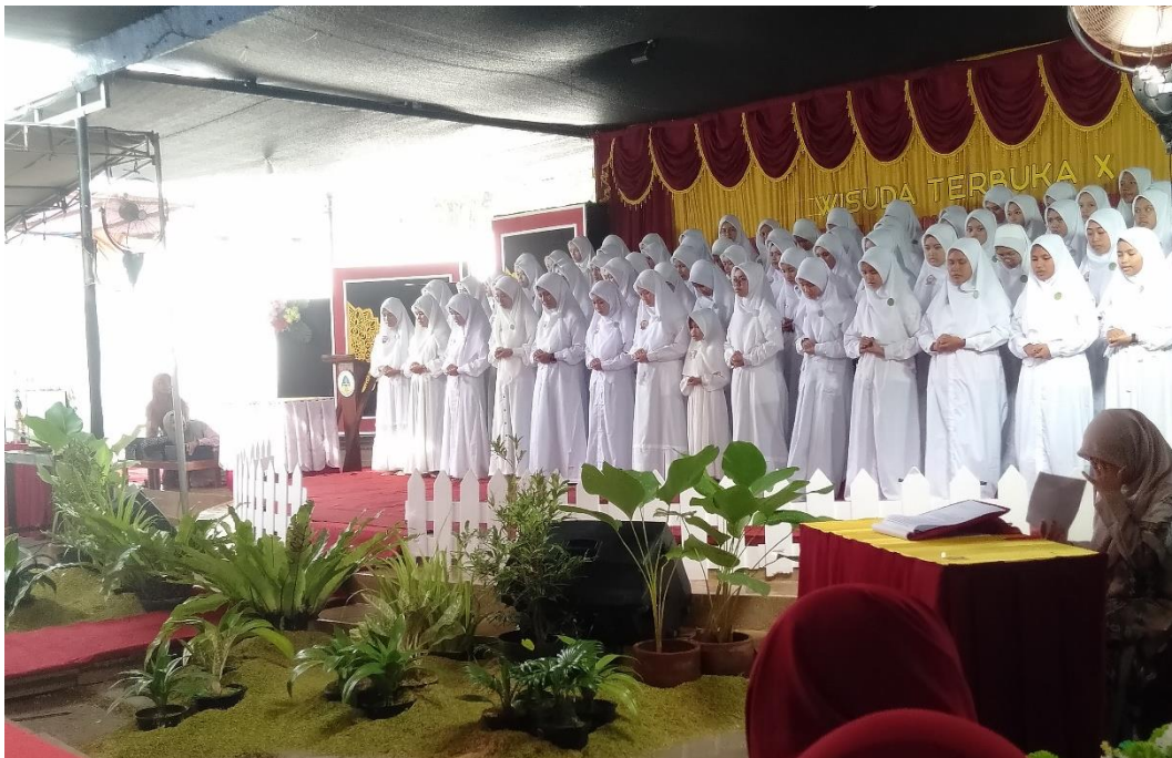
الصورة: ٢ wisuda terbuka