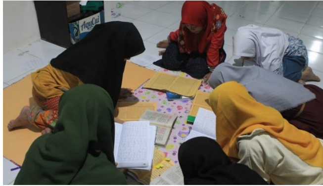
الصورة ٤.١ التعليم في الفصل

ومن الأنشطة التي تستخدم طريقة سوروكان في تنفيذ تعليمها، وصفها الباحثة أعلاه، تم استخدام طريقة السوروكان في أنشطة تدريس فتح القريب. يتم تنفيذ هذا النشاط بشكل روتيني كل صباح من قبل جميع أعضاء وإداريي جمعية تعميق الكتب، التي تنقسم إلى ١٠ فصول .