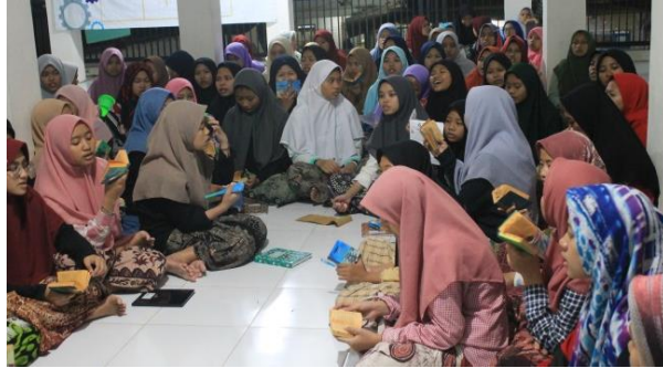
الصورة ٤. ٢ قراءة الأغنية أثناء التعليم