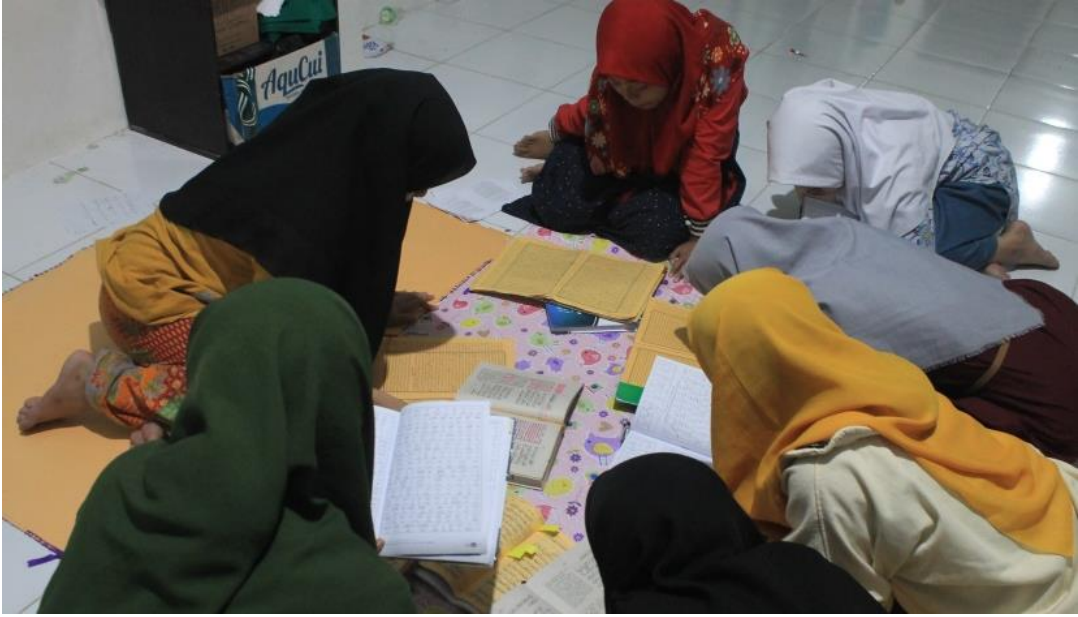
الصورة: ٣ التعليم