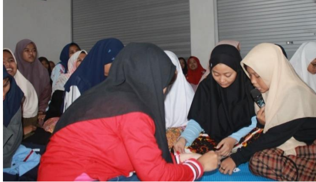
الصورة ٤ . ٣ اللعبة بين التعليم

يمكن للتعلم النشط بطريقة اللعبة ان يخلق البيئة التعليمية ممتعة، حيث ستكون الطالبات ناشطات في عملية التعلم و أكثر قدرة على العمل مع الأصدقاء الآخرين، وتكون جو الفصل الدراسي أكثر حيوية وقدرة على تحقيق أهداف التعلم المطلوبة.