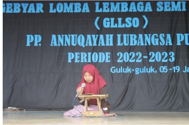
الصورة ٤. ٤ مسابقة قراءة الكتب

وكتقييم للتعلم في الفصل باستخدام طريقة سوروكان، فإن الكتاب المستخدم في هذه المسابقة هو مساوي مع الكتاب المستخدم في الفصل، وهو كتاب فتح القريب. تختلف الفصول التي سيتم قراءتها في كل مستوى دراسي. إن عملية تطبيق طريقة سوروكان لا تتم إلا في الخطوات النهائية وهي عملية التقييم.