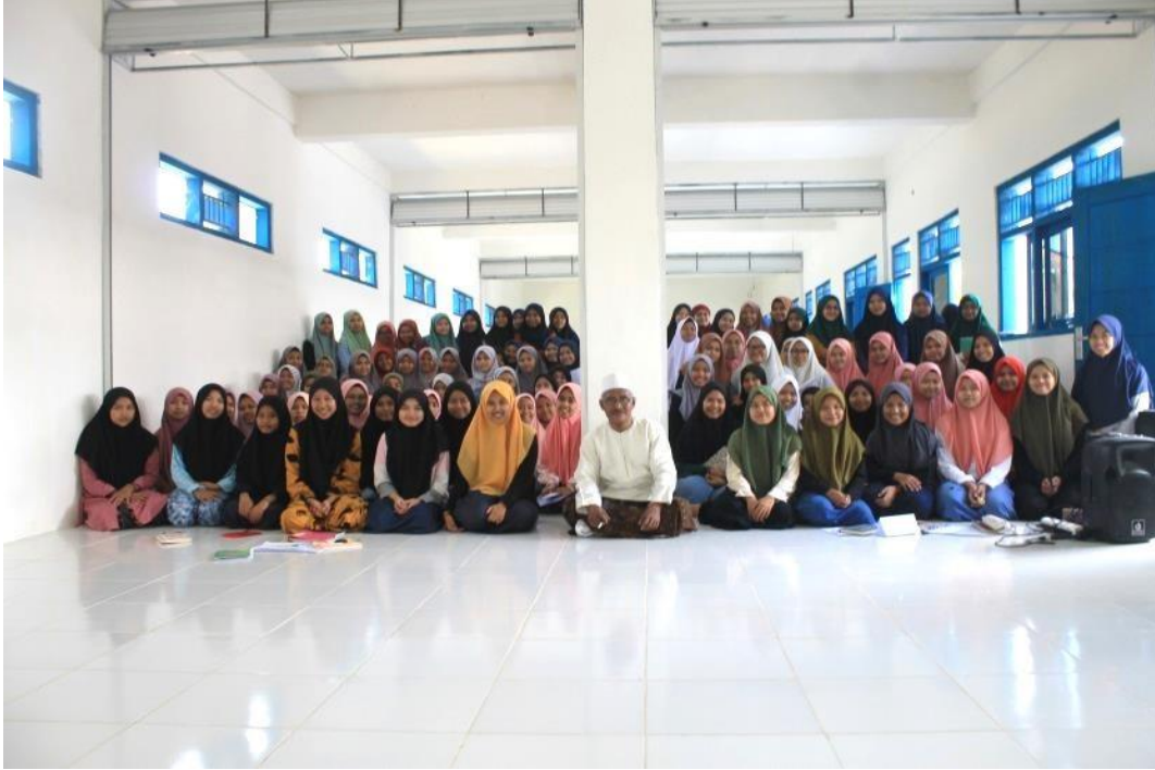
الصورة: ١ بحث المسائل