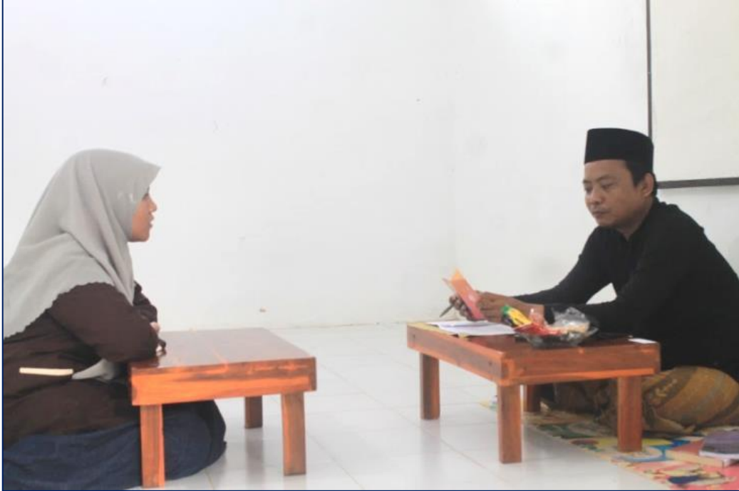
الصورة: ٤ المناقشة