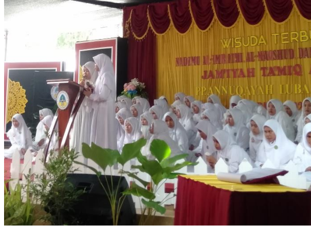
الصورة ٤ . ٦ توضيح الكتاب الفتح القريب على الخريجات بالصورة

و الكتب التي قرأها الخريجات هي كتاب فتح القريب لخريجات من مستوى العمريطي والمقصود، وكتاب كفاية الأخيار لخريجي مستوى ألفية ابن مالك.