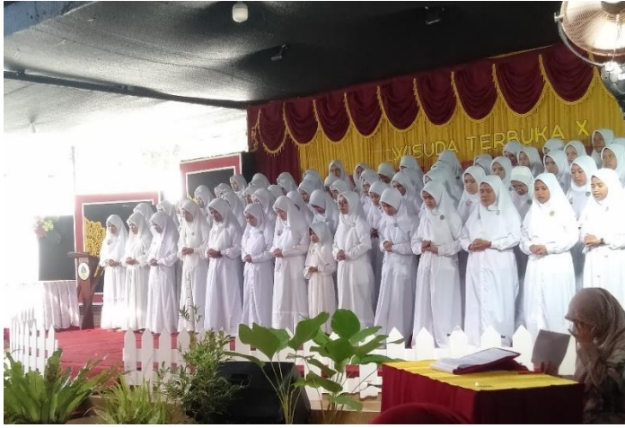
الصورة ٤. ٥

بنفس الخطوات المتبعة مع مسابقة قراءة الكتب وهي الأسئلة والأجوبة المتعلقة بمعنى النحو الذي ورد في الكتاب وموضوعه، والكتاب المستخدم في هذا النشاط هو الشريعة من كتاب العمريطي و نظم المقصود وأيضا ألفية ابن مالك . يتم