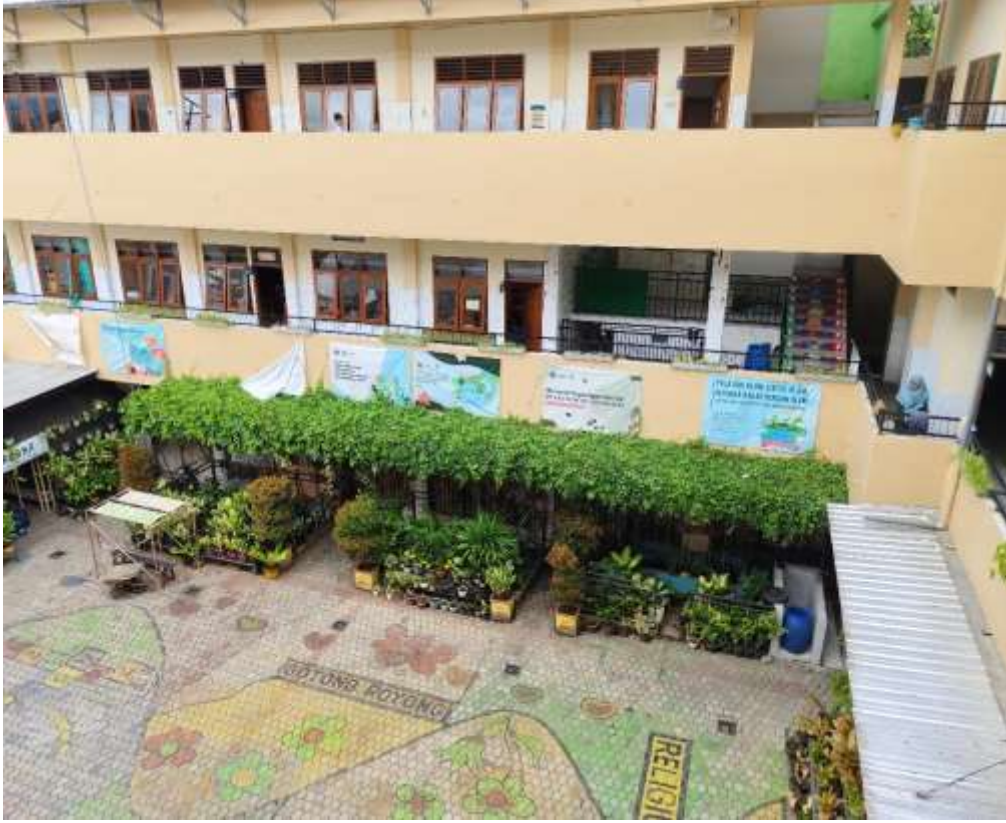
٨. صورة مدرسة سرىا بوانا الابتدائية الإسلامية مالانج