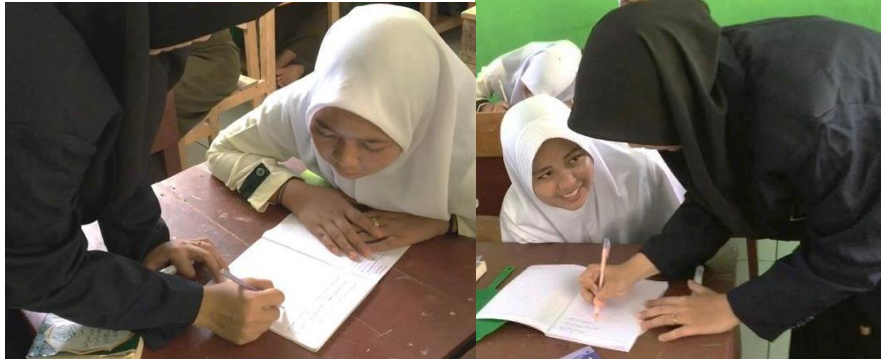
الصورة ٤،٣ تقوم الباحثة لمساعدة المعلم لتصحيح كتابة إنشاء الطلبة

ويستمعون الطلاب إلى شرح المعلم لمعرفة أخطاء النحوية في كتابتهم.