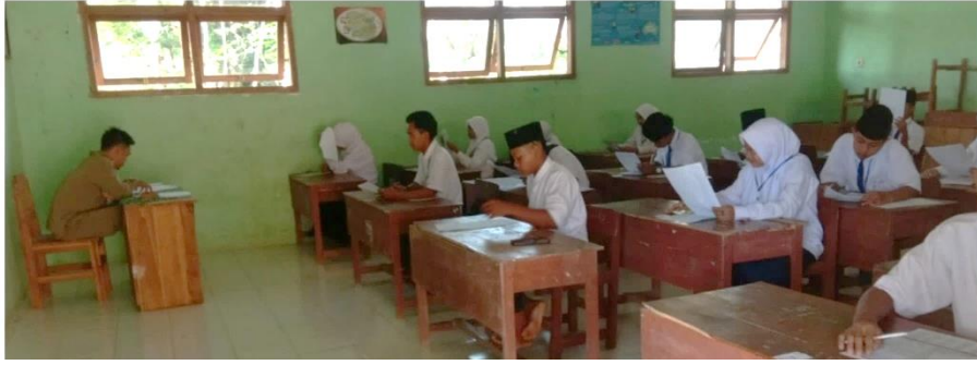
الصورة ٤،٢ يقوم المعلم بتصحيح كتابة إنشاء الطلبة

لتلاميذ المدرسة الثانوية الحكومية الثانية سيتوبوندو.