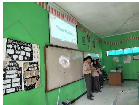
عملية التعلم بطريقة التقديم (presentation)