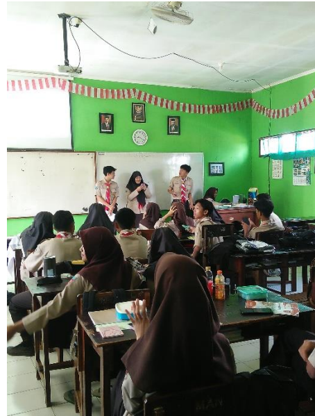
عملية التعلم بالهاتف