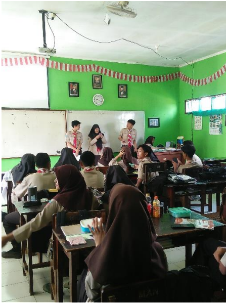
عملية التعلم بالهاتف