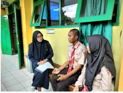
عملية المقابلة مع الطلبة