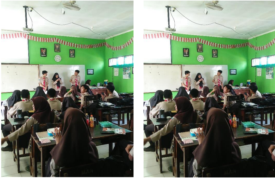
عملية التعلم بطريقة TPACK بوسائل الهاتف

ومن بيان السابق، تم إجراؤها في أنشطة عملية تعليم اللغة العربية في الفصل العاشر بالمدرسة الثانوية الحكومية الواحدة غونداانجليغي من المعروف أن المعلم يعد خطة عملية التعليم في شكل وحدات تعليمية وبشكل TPACK. تم تعزيز ذلك أيضاً من خلال نتائج مقابلة مع مدرس اللغة العربية بالمدرسة الثانوية الحكومية الواحدة غونداانجليغي الذي ذكر أن مفهوم إعداد تصميم التعليم المختار كان يستخدم وحدات التدريس وقد تم الاتفاق على ذلك من قبل جميع معلمي اللغة العربية يرجع اختيار هذه الوحدة التعليمية إلى كونها أسهل وأكثر وضوحاً وستستكشف المعلم بشكل أكبر في تطوير عملية التعليم وكذلك المواد. ٣١