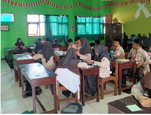
عملية التعلم اللغة العربية