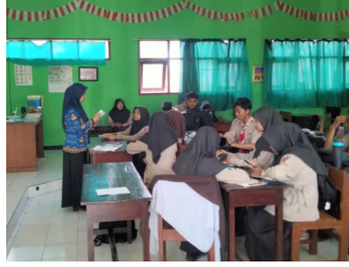
عملية التعلم بطريقة الفصل المتحرك (moving class)

بالإضافة إلى استخدام طريقة الفصل المتحرك، يستخدم معلمو اللغة العربية في عملية تعلم اللغة العربية أيضا طريقة التقديم (presentation). ٢٧ يطلب من الطلاب التقدم بدورهم لشرح نتائج تعلم الطلاب المتعلقة بمواضيع معينة. يهدف هذا النشاط التعليمي إلى توفير مساحة للطلاب للتحدث وممارسة مهارات الكلام من الطلاب. ٢٨