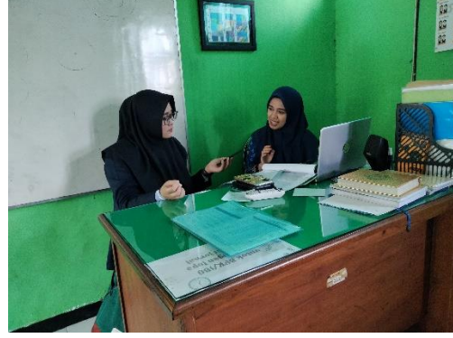
عملية المقابلة مع معلم اللغة العربية