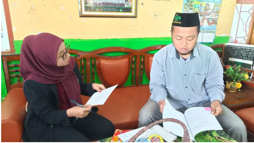
الملحق ٧: الصور من عملية البحث