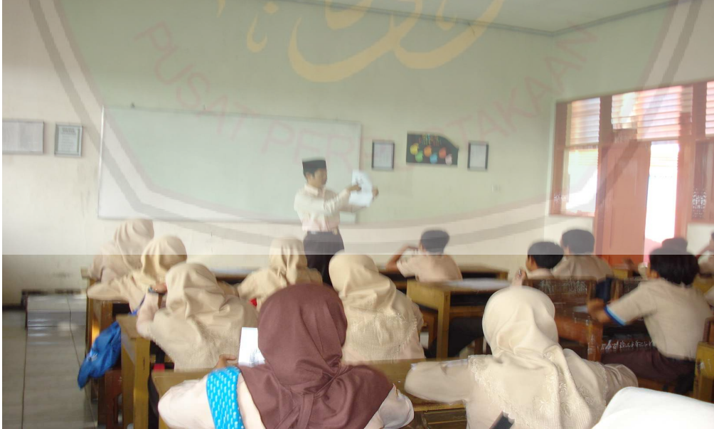
يلقي المدرس الأسئلة لدي التلاميذ وهم يجيبونها