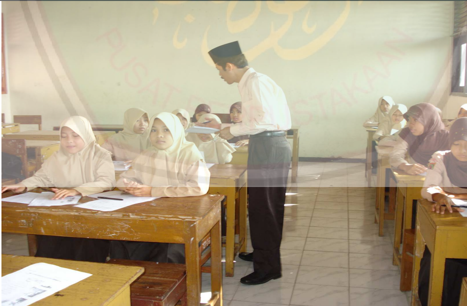
يلقي المدرس الاختبار البعدي شفويا لدي التلاميذ واحدا فواحدا