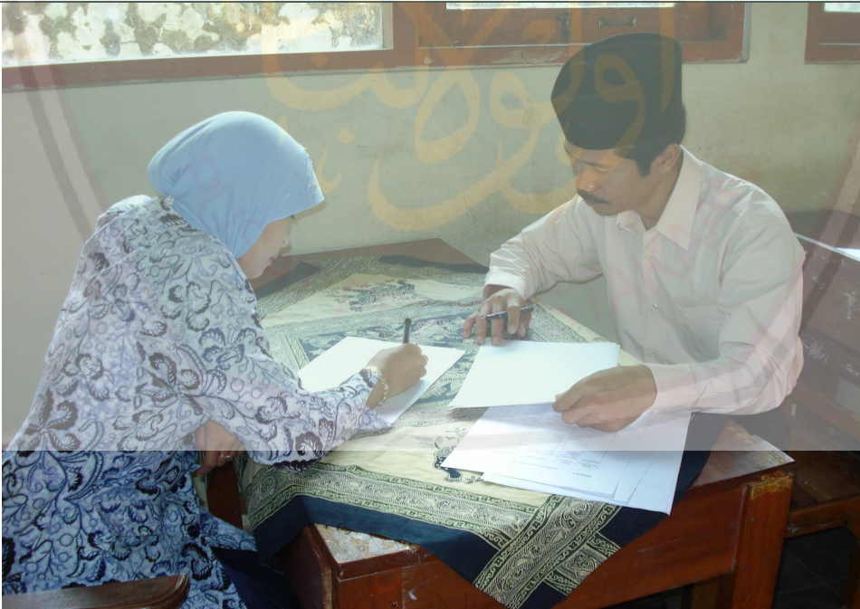
يناقش الباحث مع مدرسة اللغة العربية عن نتائج عملية التعليم والتعلم