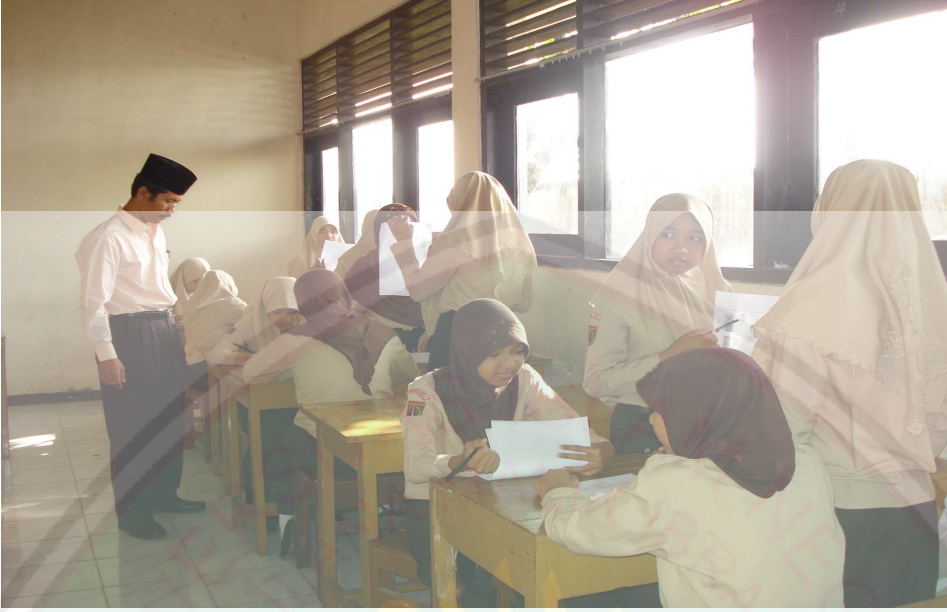
يلاحظ الباحث في أنشطة الاختبار البعدي