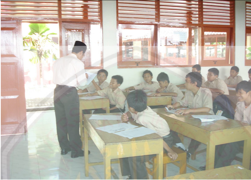
يلقي المدرس الاختبار البعدي شفويا لدي التلاميذ واحدا فواحدا