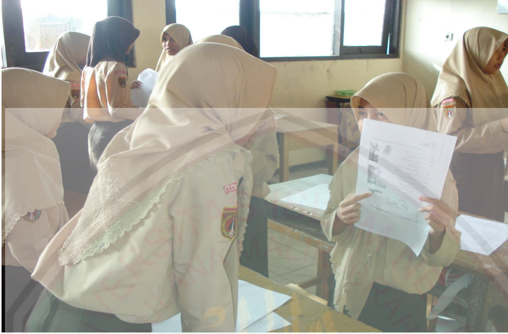
يتكلم التلاميذ مقابلة بصيغ الأسئلة والأجوبة حتى بحيث يأخذ كل دارس دوره فمرة سائلا ومرة مجيبا