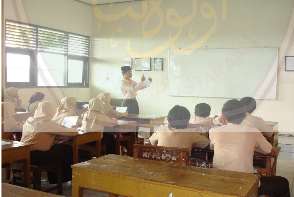
تلقي المجموعة الأسئلة وتجييبها مجموعة أجرى