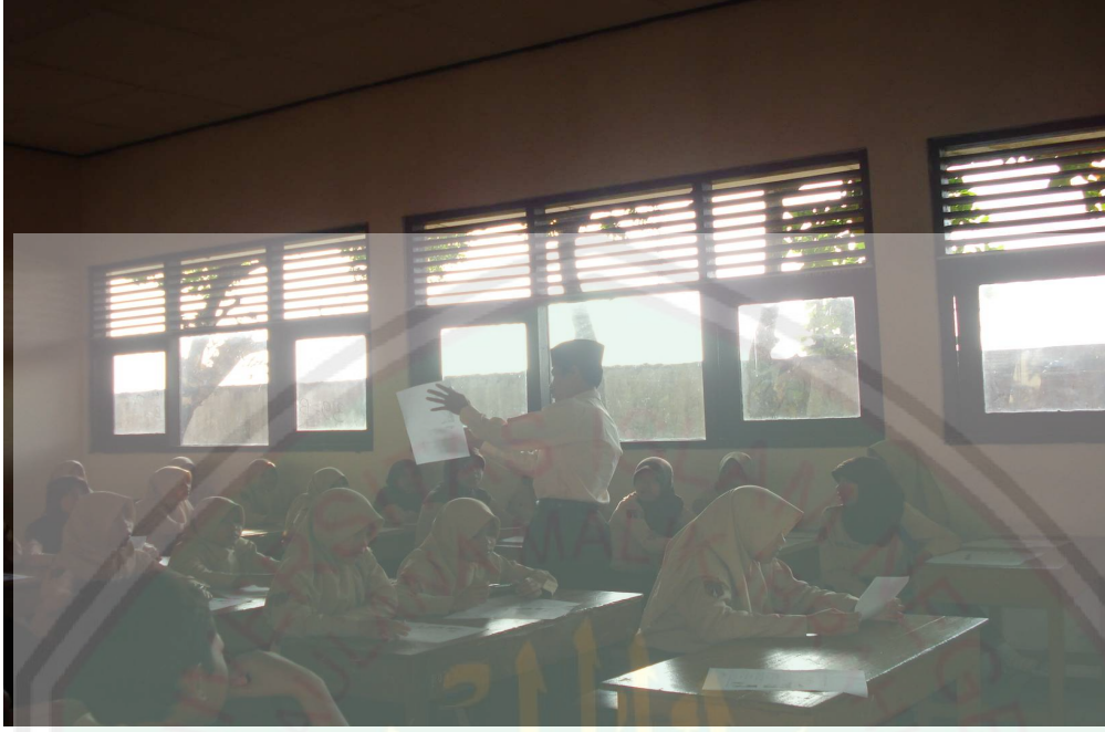
يلقي المدرس الأسئلة لدي المجموعة وهم يجيبونها