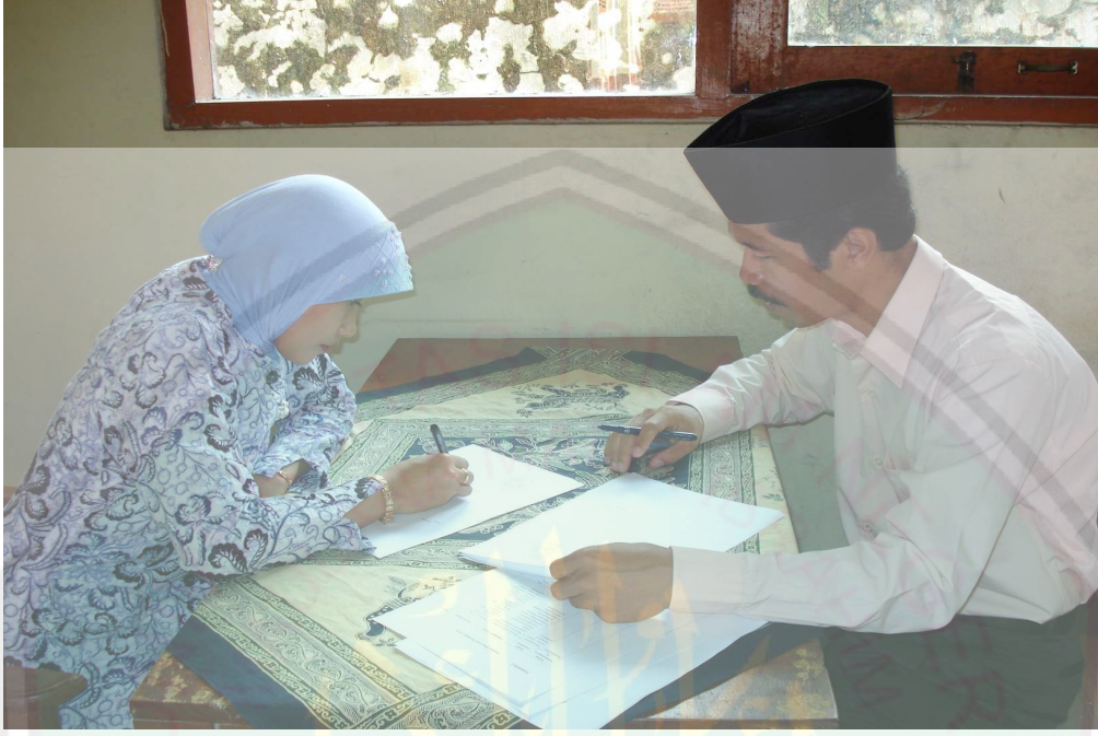
يناقس الباحث مع مدرسة اللغة العربية لعلاج المشكلات