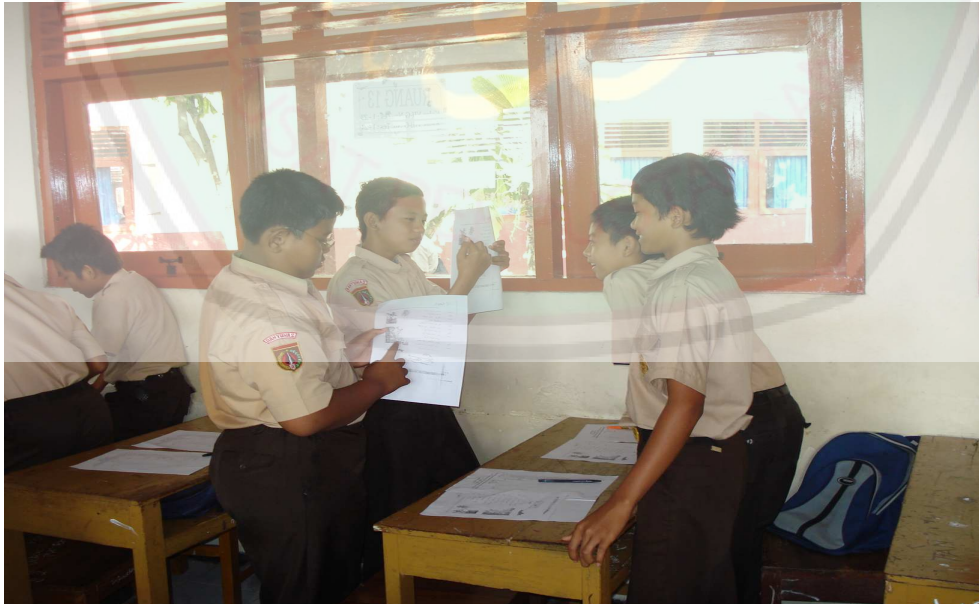
يتكلم التلاميذ مقابلة بصيغ الأسئلة والأجوبة حتى بحيث يأخذ كل دارس دوره فمرة سائلا ومرة مجيبا