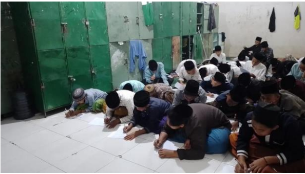
عملية التعليم عند اختبار