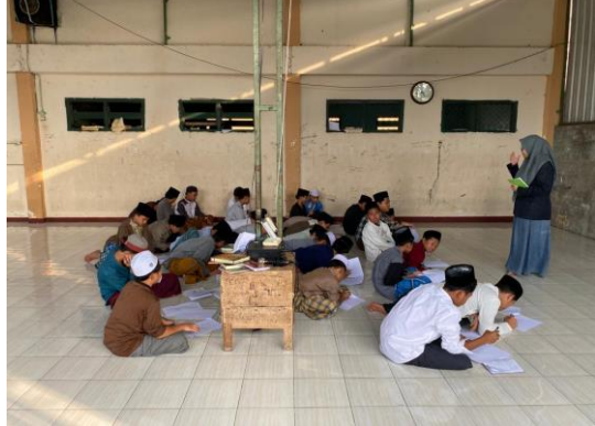
عملية التعليم عند أنشطة الأساسية