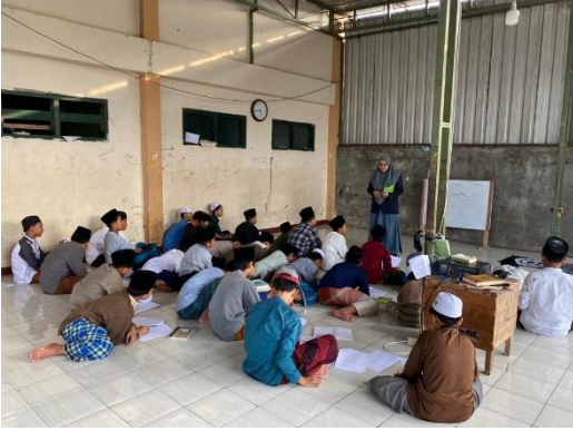
عملية التعليم عند اختبار