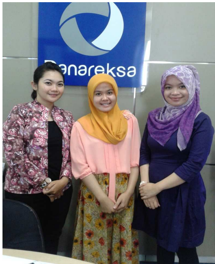
Foto Bersama Staff dan Admin PT Danareksa Malang