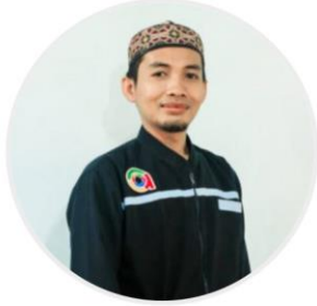
Ust. Qomsun, S.Pdi

صورة الملف الشخصي لبعض المدرسون في " تكلم " الأزهار