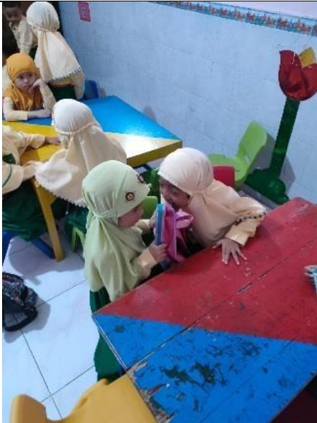
Gambar 7. Kegiatan di TK ABA 16 Kota Malang