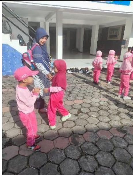
Gambar 8. Orang tua yang memberi penguatan rasa aman pada buah hatinya