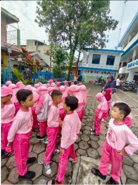
Gambar 3. Ibu Sr berpamitan dengan anak dengan memberikan rasa secure attachment kepada buah hatinya melalui gurunya di sekolah