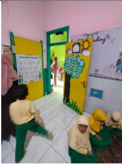
Gambar 11. ibu memastikan bahawa anak sudah tenang di dalam kelas