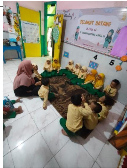
Gambar 12. Anak berani masuk kelas setelah mendapat kelekatan aman dari orang tua dan melakukan kegiatan pembelajaran dengan baik sampai akhir