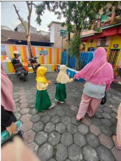
Gambar 9. Anak yang belum memberi izin pada orang tuanya untuk meninggalkannya