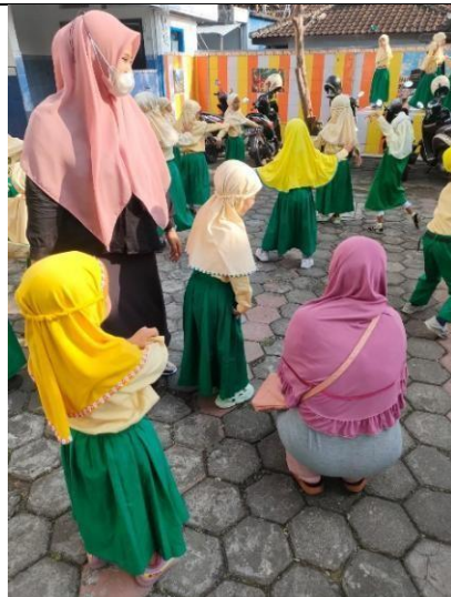
Gambar 10. peran guru dalam memberi keyakinan dan rasa aman kepada anak.