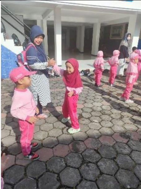
Gambar 1. Ibu Hn berpamitan dengan anak dengan memberikan rasa secure attachment kepada buah hatinya