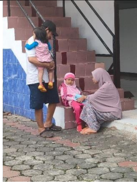
Gambar 4. Ibu Sr memberikan penguatan rasa aman terhadap putrinya