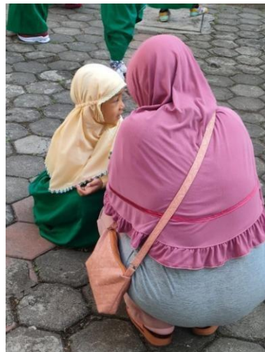
Gambar 4.1 Wali Murid memberi secure attachment kepada anak