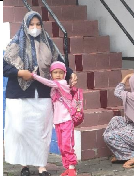
Gambar 2. Anak mulai merasakan secure attachment terhadap gurunya di sekolah