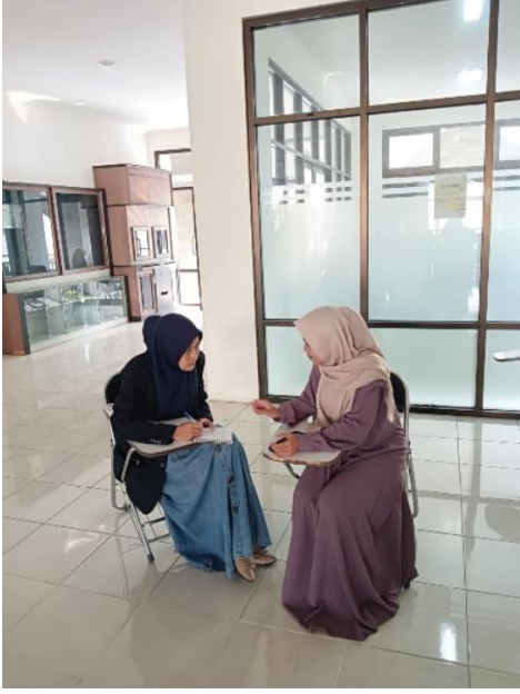
المقابلة نيساء الفي