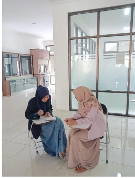
المقابلة ليسا هممة النفوس